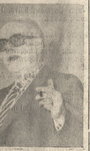
Ο κ. Καραμανλής

Ο κ. Παπανδρέου αναφέρθηκε επίσης στη διεθνή οικονομική ανταλλαγή και στις εμπορικές ανταλλαγές στο χώρο της Ανατ. Μεσογείου ως διαμετακομιστικό σταθμό στον εμπορικό δρόμο του Ατλαντικού και του Ειρηνικού, καθώς επίσης και στις οικονομικές και άλλες δυνατότητες της Ελλάδας που μπορεί να σηκώσει το βάρος ενός διεθνούς εμπορικού σταθμού, όπως εμπράκτως έχει αποδείξει με το τουριστικό ρεύμα που εξυπηρετεί κάθε χρόνο.