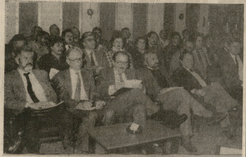
Άποψη από την πρώτη μέρα των εργασιών του Συνεδρίου.