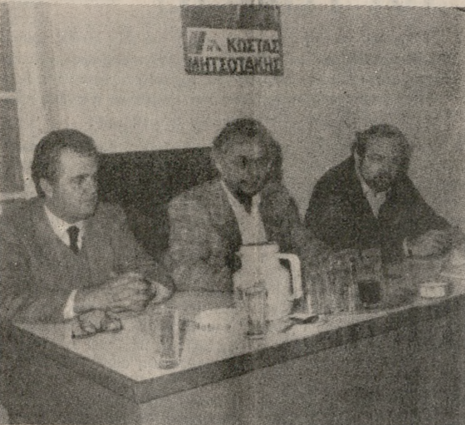
Οι εκπρόσωποι της ΝΟΔΕ Ηρακλείου στην χθεσινή συνάντηση με τους δημοσιογράφους.