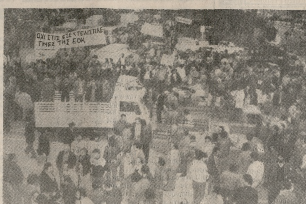
Στημιότυπο από το χθεσινό βραδινό συλλαλητήριο των αγροτών στην πλ. Ελευθερίας

Σε χθεσινή του, επίσης, δήλωση ο κ. Λαμπρινός τονίζει την ηπιότητα του προσκείμενου αγώνα, αναφέροντας ότι θέματα γενικότερης σημασίας είναι η βελτίωση της λειτουργίας των δικαστηρίων, η μετεγκατάσταση των κρατητηρίων και η συνέχιση του αγώνα για την μεταβατική έδρα του Εφετείου στο Ηράκλειο.