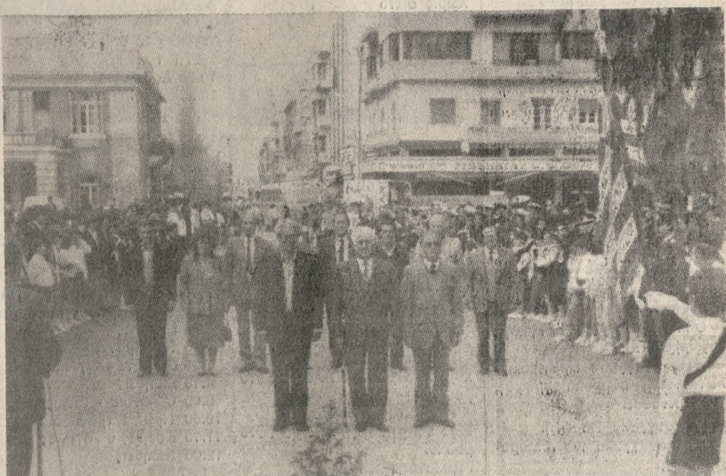
Από την χθεσινή τελετή κατάθεσης στεφάνων στο Μνημείο του Άγνωστου Στρατιώτη από μαθητές της Πρωτοβάθμιας Εκπαίδευσης.

Το σκάφος έφθασε στο λιμάνι του Ηρακλείου στις 2,30 το βράδυ.