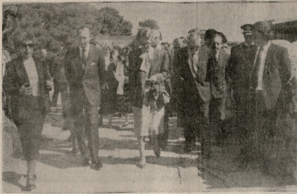
Ο Μέγας Δούκας του Λουξεμβούργου και η σύζυγός του, ξεναγονται από την κ. Καστρι- νάκη στην Κνωσό. Διακρίνεται και ο Νομάρχης κ. Μανώλης Λουκάκης.