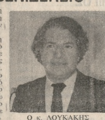
Ο κ. ΛΟΥΚΑΚΗΣ

Με το Νομάρχη κ. Μανώλη Λουκάκη συναντήθηκε χθες η Τριμελής επιτροπή των γιατρών του Βενιζελίου Νοσοκομείου. Σύμφωνα με πληροφορίες η συνάντηση έγινε ύστερα από πρωτοβουλία των γιατρών με τη την πρόσφατη κρίση στις σχέσεις Διοίκησης - γιατρών. Στη συνάντηση οι εκπρόσωποι των γιατρών ζήτησαν από τον κ. Μ. Λουκάκη να συγκροτηθεί στο νοσοκομείο και να προχωρήσει άμεσα το θέμα της επέκτασης του Βενιζελίου Νοσοκομείου. Στα αυτιάματα αυτά ο κ. Νομάρχης δεν δεσμεύθηκε οριστικά όμως νέα συνάντηση για την επόμενη εβδομάδα.