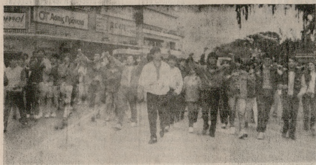
Μαθητές και μαθήτριες εκδρομείς, κατευθύνονται στη Νομαρχία, χθες το πρωί.

Με έκτακτες πτήσεις της Ο.Α. και πολεμικά πλοία