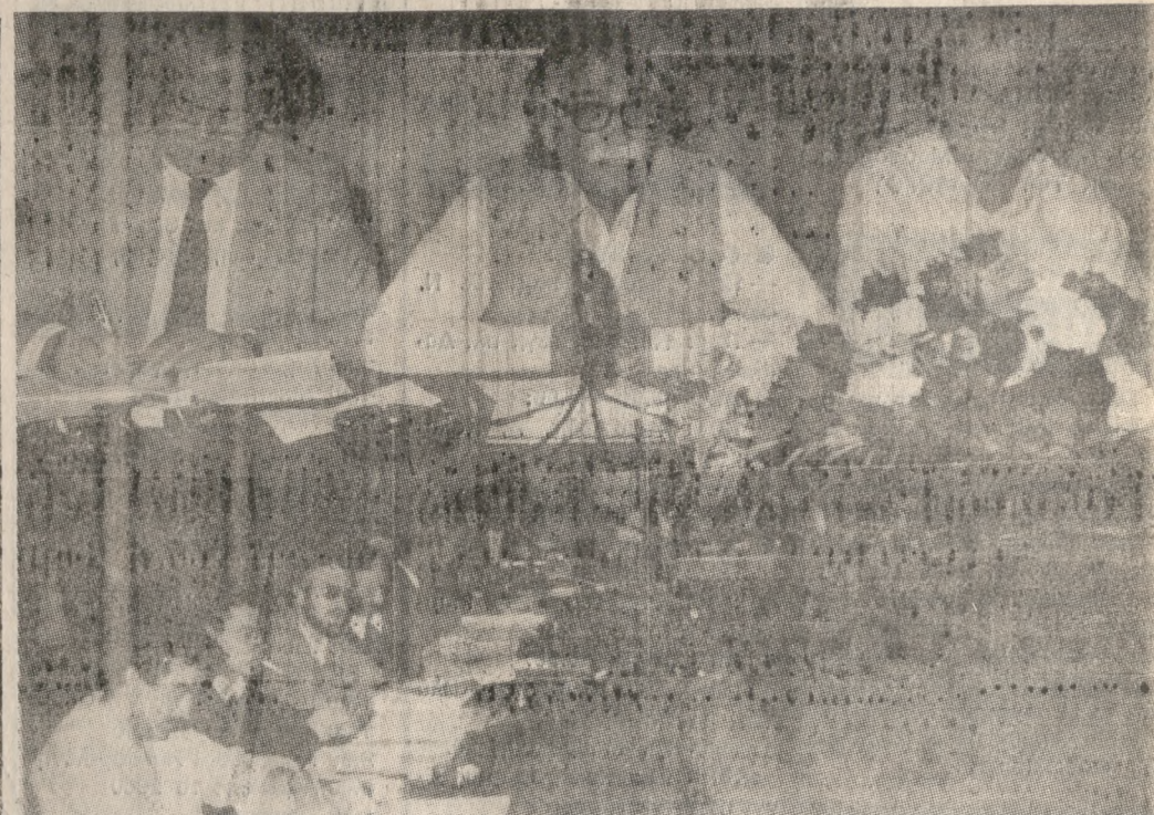
Το προεδρείο της χθεσινής συνεδρίασης του Συνδέσμου ΤΕΔΚ Κρήτης (πάνω) και μέλη των συνεδρών.

Την Τρίτη στις 8.30 το βράδυ θα συνεδριάσει στην αίθουσα «Θεοτοκόπουλος» το Δημοτικό Συμβούλιο, το οποίο θα ασχοληθεί με τα παρακάτω θέματα: — Ενημέρωση Δημοτικού Συμβουλίου για τα αποτελέσματα μελέτης απορριμμάτων. — Συζήτηση πρακτικού Επιτροπής εξερεύνησης χώρου για την ανέγερση εργοστασίου χυμολογίας των απορριμμάτων του Δήμου. — Πρόσληψη προσωπικού για τις ανάγκες της Δημ. Βικελαίας Βιβλιοθήκης. — Πρόσληψη τριών (3) εργατών για τις ανάγκες της Υπηρεσίας των Δημοτικών Νεκροταφείων. — Πρόσληψη υπαλλήλου για τη διεκπεραίωση γραφικής Υπηρεσίας των ΚΑΠΗ. — Διάθεση πίστώσης για την πληρωμή της μακέτας του Πολιτιστικού Κέντρου Ηρακλείου. — Διάθεση πίστώσης για πληρωμή δαπάνων των συνεχιζόμενων έργων. Αναμόρφωση Προύπολογισμού. — Αγόρα αυτοκινήτων από τον ΟΑΔΥ. — Τρόπος εκτέλεσης του έργου «Συντήρηση Σχολικών Κτιρίων». — Καθορισμός αξίας απαλλοτριούμενων ακινήτων από το Δήμο. — Τρόπος εκτέλεσης του έργου «Κατασκευή πεζοδρομίων Ι, ΙΙ και ΙΙΙ». — Μελέτη «Τοιμενοστρώσεις οδών» με αντιπαρατάσεις. — Έγκριση όρων διακήρυξης Δημοπρασίας του έργου «Αγροτική Οδοποιία, δρόμοι εκτός Σχεδίου Πόλης». — Έγκριση όρων διακήρυξης Δημοπρασίας των έργων «Ασφαλοστρώσεις κλειστού τύπου έτους 1987 (Έργα Νο 1, 2, 3, 4)». — Μελέτη «Διάνοξη, διαμόρφωση βελτίωση βατότητας οδών έργα Νο 1, 2» με αντιπαρατάσεις. — Μελέτη «Συντήρηση ασφαλτικών οδοστρωμάτων έργα Νο 1 και 2» με αντιπαρατάσεις. — Μελέτη «Αγροτική οδοποιία - βελτίωση βατότητας αγροτικών δρόμων» με αντιπαρατάσεις.