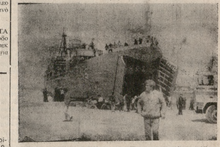
έμειναν για μέρες στο λιμάνι μας. Στη φωτογραφία του Νίκου Μολταζάκη (Γρανισιάν 19, τηλ. 285261) το αρματαγωγό «Αφροί» στο λιμάνι, χθες το μεσημέρι.

ΠΟΛΕΜΙΚΑ πλοία έφθασαν χθες στο Ηράκλειο για να πάρουν τους εκδρομείς μαθητές καθώς και κάποια αυτοκίνητα - ψυγεία που