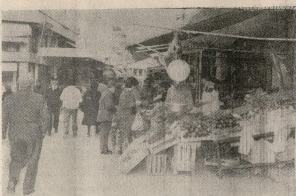
Επάρκεια φρούτων και λαχανικών στην Πασχαλινή Κεντρική Αγορά.