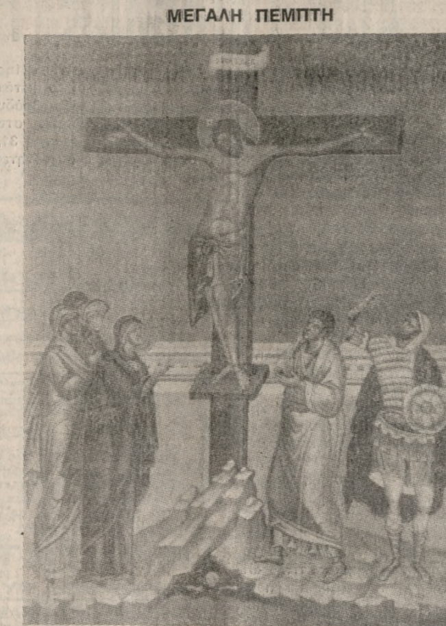
Σήμερα κρεμάται επί ξύλου...

Στο τηλεγράφημα αναφέρεται: Δικηγορικός Κόσμος Ηρακλείου μένει κατάπληκτος από δημοσιογραφικές πληροφορίες για επικείμενη αύξηση τεκμηρίου βιωσιμότητας δικηγόρων από 550.000 σε 700.000 Δρχ.