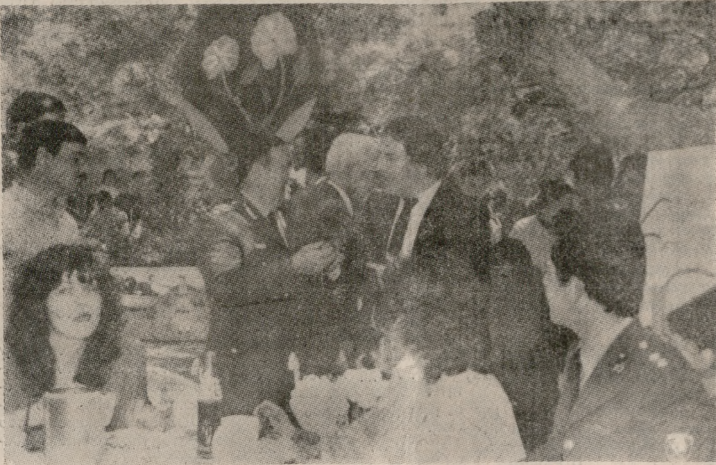
Ευχές, τσουγκριάματα και χαμόγελα από το Νομάρχη Ηρακλείου κ. Μανώλη Λουκάκη, ο οποίος γύρισε το Πάσχα με τους στρατευμένους στο Στρατόπεδο της ΣΕΑΠ. Τον κ. Νομάρχη υποδέχτηκε στο Στρατόπεδο ο Διοικητής της Σχολής, Αξιωματικοί, μαθητές, συγγενείς των στρατευμένων και πλήθος κόσμου. Στον χώρο προσέλασαν στήθηκε μέχρι αργά το απόγευμα γλέντι, με χορούς και τραγούδια.