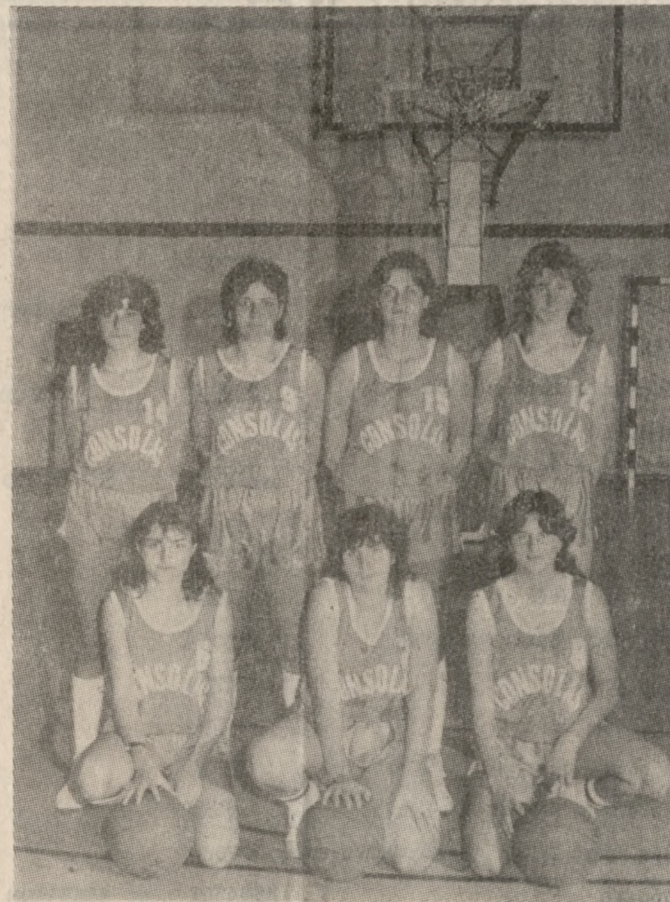
Οι αθλήτριες της Γυναικείας ομάδας μπάσκετ του Ηροδότου οι οποίες — μαζί με τις άλλες που δεν είναι στη φωτογραφία μας — ανέβασαν τον Σύλλογο τους στην Α' Εθνική.

• ΑΡΧΙΖΕΙ σήμερα το πρωτάθλημα Μπάσκετ Ηρακλείου στην Αίθουσα Σπορτών. Σύμφωνα με το πρόγραμμα προβλέπεται να γίνουν οι παρακάτω αγώνες: 2ο Γυμν. Ηρακλείου - 11ο Γυμν. με διαφορά 7 μ.μ. με ημερομηνία 5ο - Μάλια στο κλειστό στις 4 μ.μ. με διατηρητές τους κ. Χατζάκη και Κατράκη.