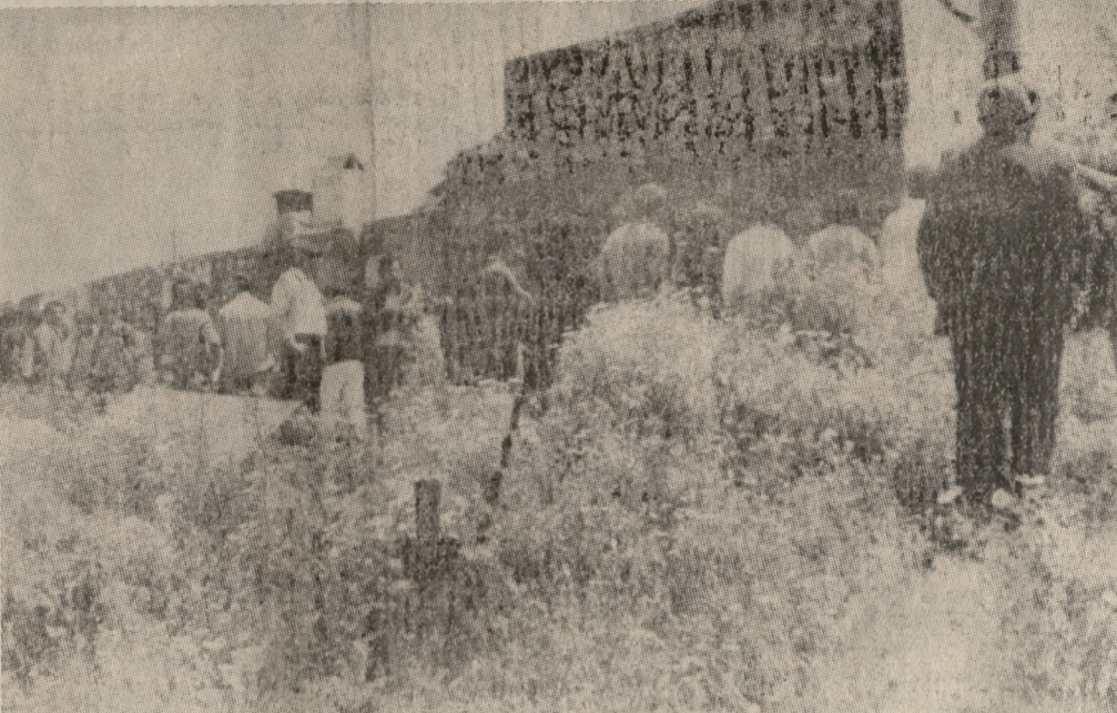
Στο κλιό της φωτογραφίας διακρίνεται το σπίτι του θύματος στην Τύλισσο ενώ με το βέλος σημειώνεται το σημείο όπου είχε σπύρει η ενέδρα στον Σκούλα.

Αμέσως μετά μίλησε ο Γενικός Γραμματέας του Υπουργείου κ. Λεωνίδας Οικονομίας, ο οποίος αναφέρθηκε στην υδατοκαλλιέργεια και στην υδατοκαλλιέργεια.