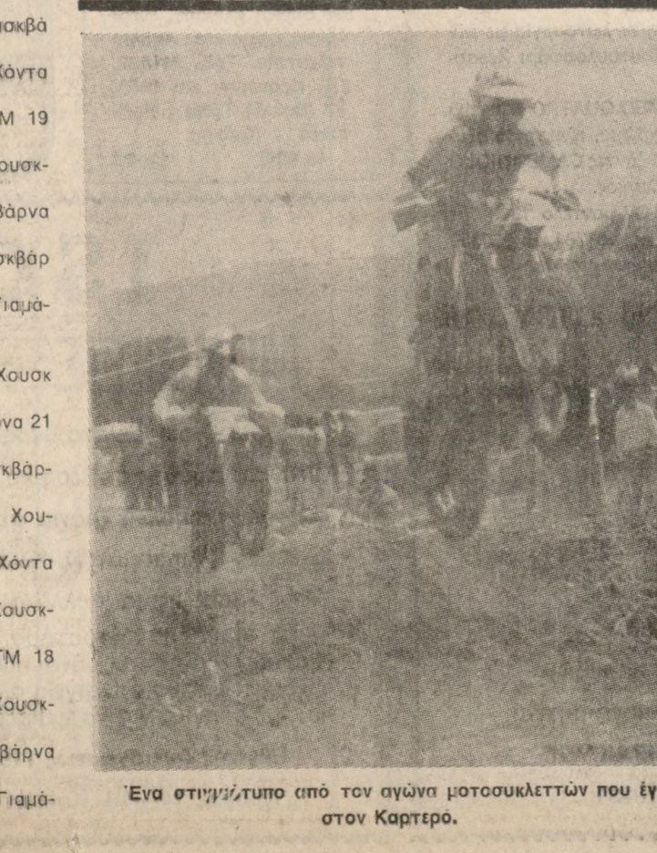
Ένα στιγμιότυπο από τον αγώνα μοτοσυκλετών που έγινε στον Καρτερό.