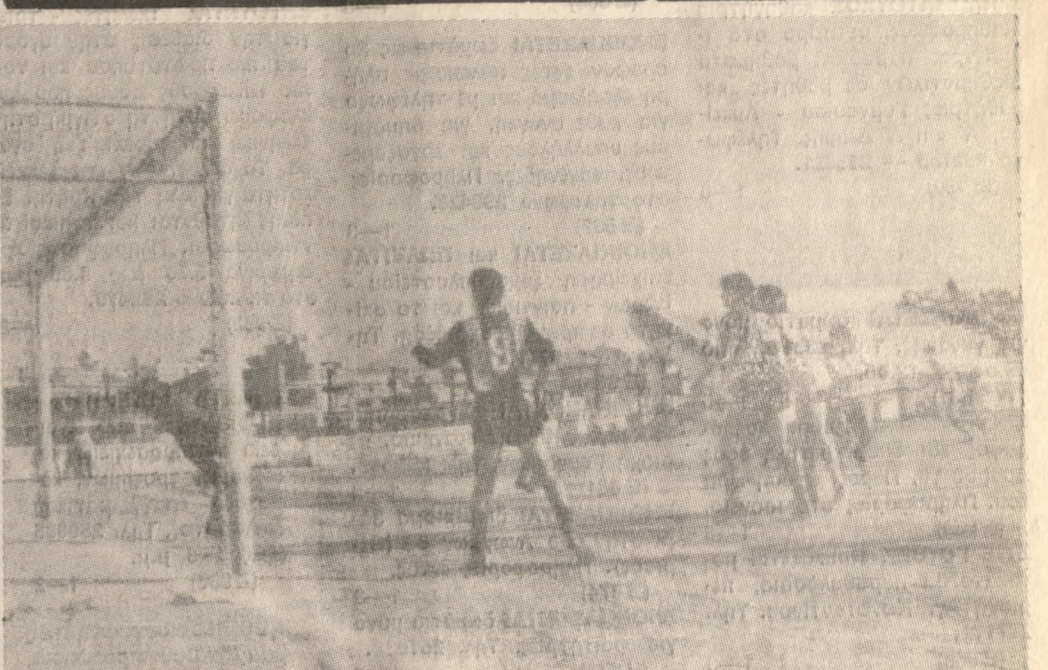
Ο Δούκας σημειώνει το πεντακάθαρο γκολ, ο διαιτητής θα ακυρώσει, χωρίς να υπάρχει λόγος!!!