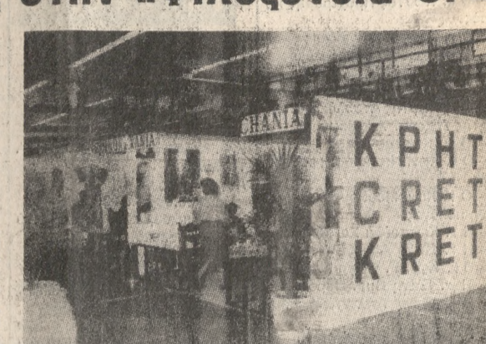
Η είσοδος του περιπτέρου της Κρήτης στην ΦΙΛΟΞΕΝΙΑ '87.

Μετά τις «δελφικές» ομαδικές εκθέσεις που συνόλην στέλνουν τον τουριστικό μας φορέον και παραρταστές του νησιού μας σε Εξθέσεις του μετέχοντος της ΙΤΒ του Βερολίνου της Επολής του Λονδίνου, της Επολής της Μοντρέ, ήλθε τα τελευταία χρόνια η συνεχής ανθροσμένη ΦΙΛΟΞΕΝΙΑ της Θεσσαλονίκης, για να δώσει την ευκαιρία στους Κρητικούς να δείξουν την «σμίαση» και το ομαδικό πνεύμα τους σε το μείς προβολής των αρετών της Κρήτης.