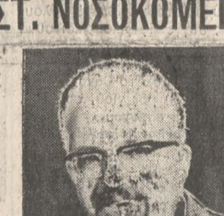
Τα Νοσοκομεία αυτά θα λειτουργήσουν ως Περιφερειακά Πανεπιστημιακά Νοσοκομεία.