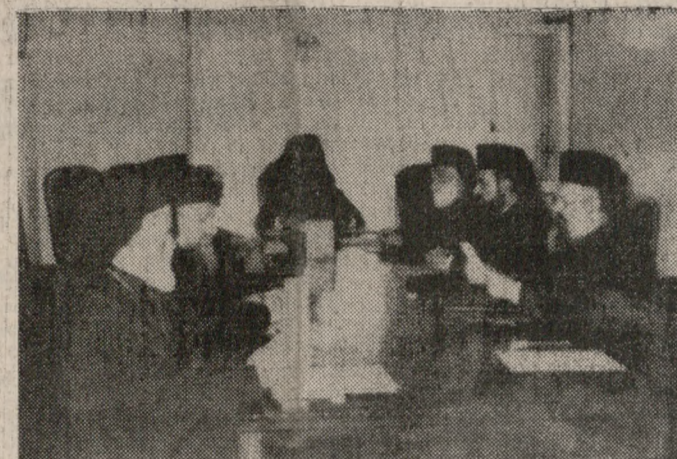
Άποψη από την τελευταία Σύνοδο της Εκκλησίας της Κρήτης.

ΚΑΤΣΑΝΕΒΑΣ Α.Ε.Β.Ε. Γνωστοποιεί στους συνεργάτες της ότι από 20-5-87 ημερήσια Δευτέρα, θα λειτουργήσει στην Βιομηχανική Περιοχή Ηρακλείου, οδός Α. Τα νέα της τηλεφώνω είναι: 229460 - 1 - 2.