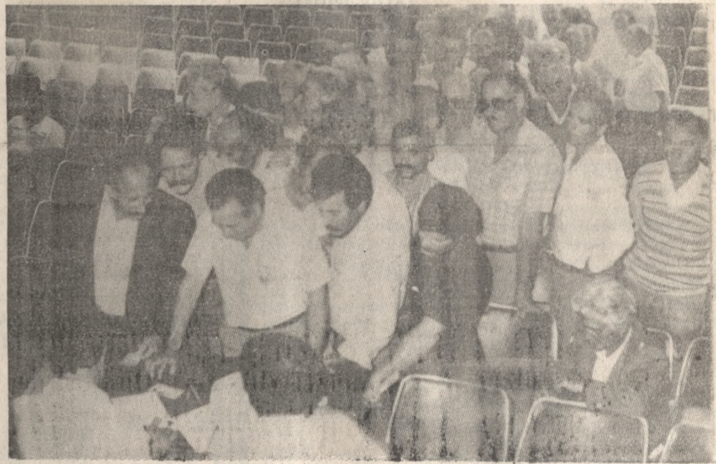
Άποψη από την χθεσινή ψηφοφορία των αντιπροσώπων της Ε.Γ.Σ.Η.

Για την «Ελαιοργική» 23, για την ΚΣΟΣ 10, για την ΚΥΔΕΠ 16, για την «Κτηνοτροφική» 8, για τη ΣΚΟΠ 6, για τη ΣΠ.Ε. ΑΕ 3, για την Α.Σ.Ε. 3, για τη «Σουλτένωση» 5, για την Αγροτική ΑΕΕΓΑ 3, για τη ΣΥΝΕΛ 3, για τη Συνεταιριστική ΑΕΕΓΑ 3, για τη ΣΥΒΙΠΥ 2, για τη ΣΥΦΙΝΗ 2 και για τη Συνεταιριστική Εταιρία Εμπορίας Οπωροκηπευτικών 2.