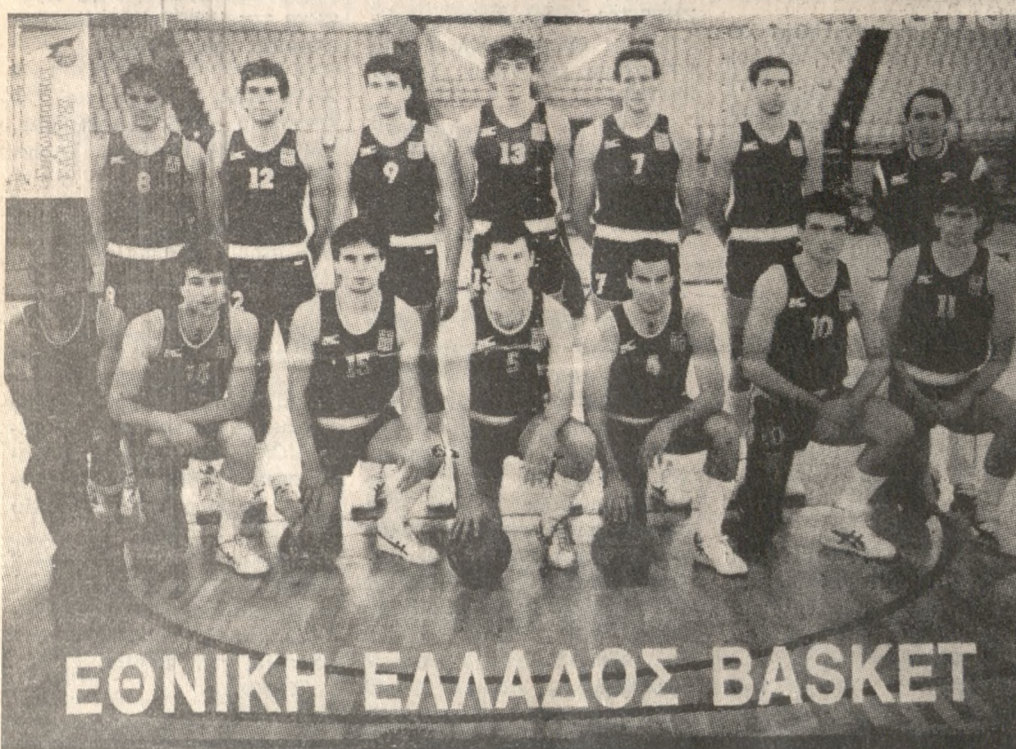
ΕΘΝΙΚΗ ΕΛΛΑΔΟΣ BASKET