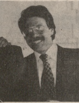
Ο νέος Νομάρχης Αιτωλοακαρνανίας, συμπολίτης μας κ. Γιώργος Παπαϊωάννου, Μηχανικός.

γκεκριμένο - εξωκυβερνητικό - «σχολό πρόσωπο».