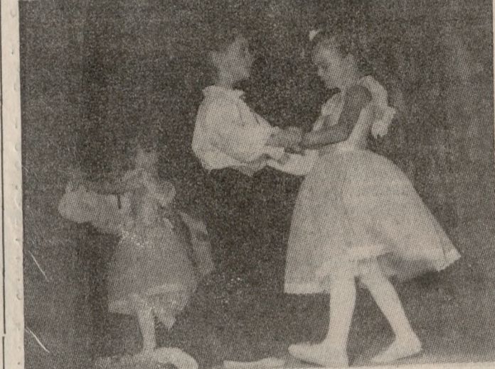
Την προχθεσινή εκδήλωση του Λυκείου Ελληνίδων στο Κηπεύειο τρα Νίκος Καζαντζάκης.

ΧΑΡΗ και αρμονία. Όλοι απόλασαν ένα θαυμάσιο θέαμα από