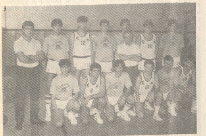
Η ομάδα Μπάσκετ Εφήβων που ΠΑΟΚ που είναι από τα φαβορί για την κατάκτηση του πρωταθλήματος Εφήβων που γίνεται στο κλειστό της πόλης μας.