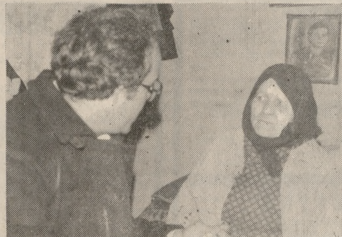
Η Καρκανάκη με συντάκτη μας στο σπίτι της

Πανελλήνιο σάλο έχει προκαλέσει από χτες η δημοσιοποίηση - αποκάλυψη των στοιχείων που σχετίζονται με τις υποθέσεις «ανεξιχνίαστων θανάτων» που ερευνά το τελευταίο διάστημα η Δικαιοσύνη, μετά από σχετική εντολή του Εισαγγελέα Ηρακλείου κ. Αντώνη Μήτση. Το όλο θέμα, μετά την αποκάλυψη της «Π», απασχόλησε σε μακροεπίπεδο, μεταξύ των αθηναϊκών εφημερίδων «ΑΠΟΓΕΥΜΑΤΙΝΗ», «ΑΥΡΙΑΝΗ», «ΕΘΝΟΣ», «ΕΛΕΥΘΕΡΟΣ ΤΥΠΟΣ» και «ΠΡΩΤΗ», ενώ η Κοινή Γνώμη έχει αληθινά συγκλονιστεί για τις συνθήκες κάτω από τις οποίες έγιναν τα περιστατικά.