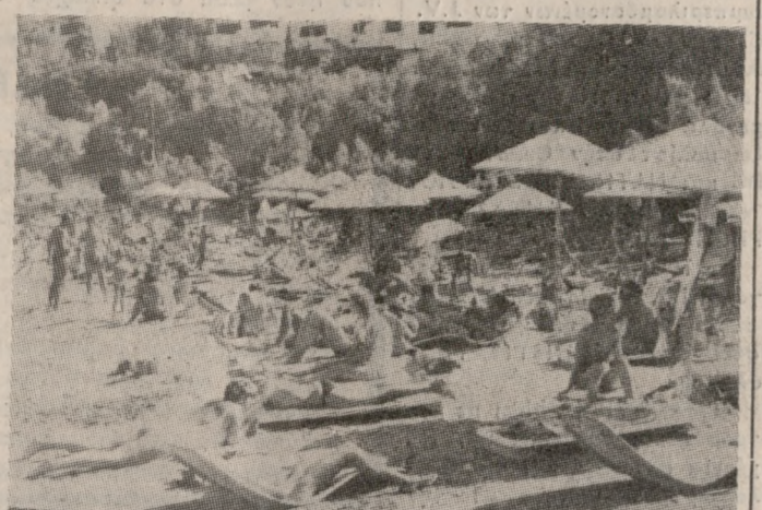
Καρφίτσα δεν έπεφε χθες στις παραλίες. Οι Ηρακλειώτες εξορμήσαν σ' αυτές μαζικά, αφού ο καύωνας ήταν αφόρητος.

«Κάηκε» και χθες ο νομός Ηρακλείου από τον καύωνα, παρότι ένα αεράκι έκανε δειλά-δειλά την εμφάνισή του. Ο πώς ήταν φυσικό χιλιάδες Ηρακλειώτες εκμεταλλευόμενοι την ηλιόλουστη Τετάρτη, προσπάθησαν να βρουν δροσιά στις παραλίες στις οποίες, κυριολεκτικά, δεν έπεφε καρφίτσα.