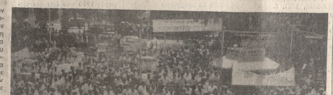
Άποψη από παλιότερη κινητοποίηση των αγροτών.

Αρχική νέων μαζικών αγώνων του αγροτικού κόσμου του Νομού, για την ικανοποίηση των αιτημάτων των αμπελοκαλλιεργητών — που θα σημάνει αυτομάτως την ύπαρξη ενός τερματισμού και ουσιαστικού άφελλου για ολόκληρη την οικονομία του Ηρακλείου — χαρακτηρίζεται η σημερινή συγκέντρωση των αγροτών στην πλατ. Ελευθερίας που θα ξεκινήσει στις 10 π.μ.