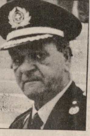
Ο κ. ΑΡΚΟΥΔΕΑΣ

Ο αρχηγός της Ελληνικής Αστυνομίας Αντιστράτηγος Νίκων Αρκούδεας επίθεωρεσε χθες το πρωί τις υπηρεσίες της ΕΛΑΣ Ηρακλείου. Ο κ. Αρκούδεας το μεσημέρι μίλησε σε συζήτηση αξιωματικών και υπαξιωματικών της Αστυνομίας στα Γραφεία της Αστυνομικής Διεύθυνσης.