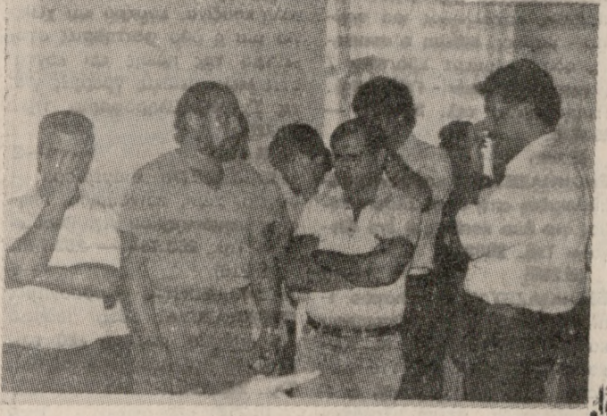
Μέλη του πληρώματος στο γραφείο του Εισαγγελέα. Αριστερά ο Έλληνας Πλωτάρχης.