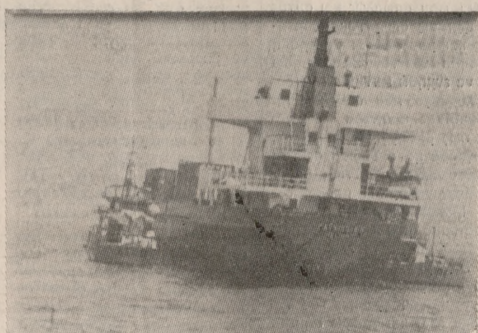
Το «Πατρίσια» στο λιμάνι του Ηρακλείου.