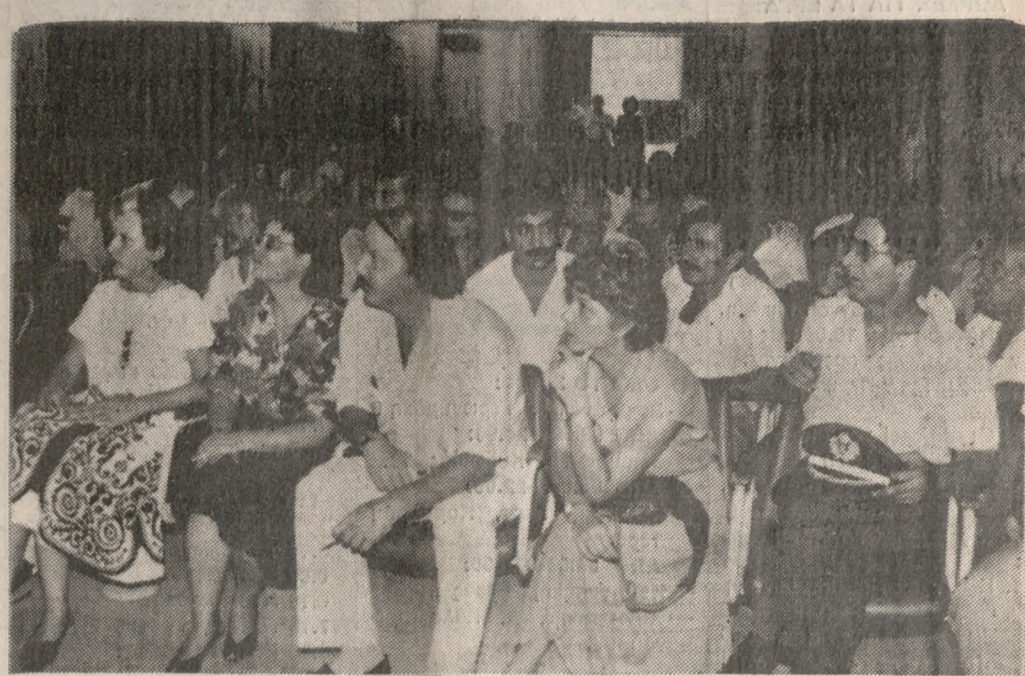
Κατόμηση η αίθουσα του ΕΚΗ κατά τη χθεσινή τελετή.