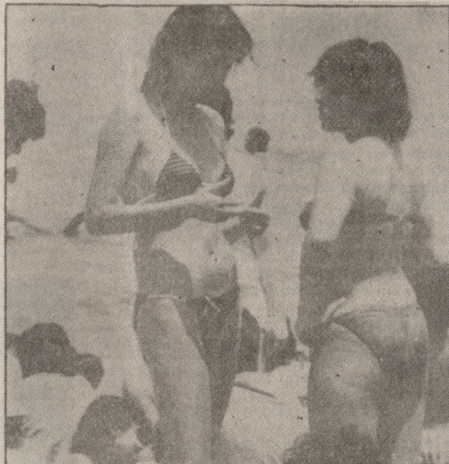
Λίγη δροσιά μακριά απ' την τσιμεντούπολη όπου η κατάσταση ήταν αφόρητη.

Χαρίς κλιματισμό, μέσα στον αφάνητο καύσωνα, βρίσκονται από την αρχή του καλοκαιριού οι αίθουσες του αεροδρομίου Ηρακλείου.