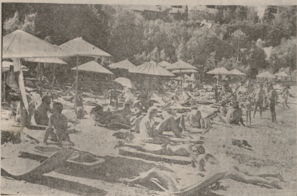
Ασφυκτικά γεμάτες οι παραλίες, ήταν οι μοναδικοί τόποι δροσιάς.

Οι εκπρόσωποι του τουριστικού κυκλώματος στις ομιλίες τους επισημάνθηκαν τα προβλήματα κυρίως υποδομής που αντιμετωπίζει ο Τουρισμός σήμερα στην Κρήτη επισημαίνοντας την ανάγκη αύξησης των χρηματοδοτήσεων στον τομέα αυτό καθώς επίσης και στην δημιουργία τριτέρων.