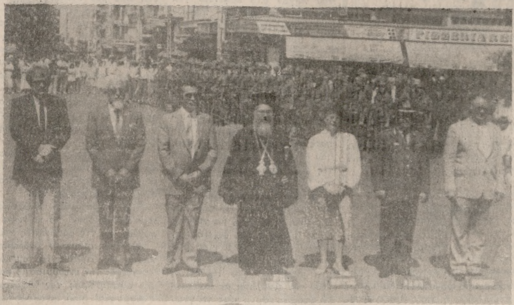
Από τον προχθεσινό εορτασμό της Ημέρας των Ενόπλων Δυνάμεων στην πόλη μας. Στις εορταστικές εκδηλώσεις την Κυβέρνηση εκπροσώπησε ο υπουργός Εσωτερικών κ. Μανώλης Παπασιδανός. Στο κέντρο της φωτογραφίας διακρίνονται ο Γενικός Γραμματέας Αθλητισμού, ο βουλευτής κ. Μαν. Δρεττάκης, ο υπουργός Εσωτερικών, ο Αρχιεπίσκοπος Κρήτης, η Νομάρχης Ηρακλείου, ο Ανώτ. Διοικητής Φρουράς Ηρακλείου και ο Δήμαρχος.