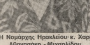
Η Νομάρχης Ηρακλείου κ. Χαράς Αθανασάκη - Μιχαηλίδου.