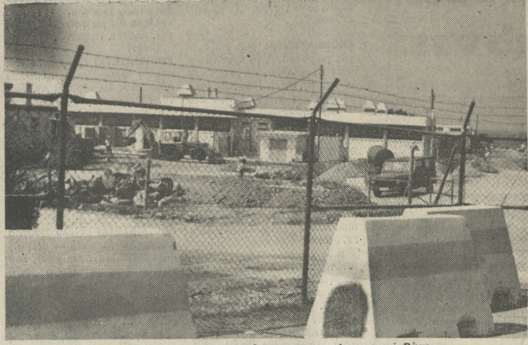
Στη φωτογραφία έργα που γίνονται στην Αμερικανική Βάση.