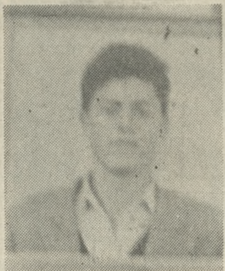
Ο στυγερός δολοφόνος Νικ. Καρυωτάκης.

ΚΑΤΩ από συνθήκες τρόμου και αγωνίας από τον φόβο μήπως και υπάρξουν και άλλα θύματα στην περιοχή, ζουν από προχθές οι κάτοικοι της Κασταμονίτσας. Για πρώτη φορά κατάγγελλαν χθες κάτοικοι της περιοχής στην «Π», σ' ολοκληρωτή την επαρχία υπάρχει έντονη η αίσθηση ανυπαρξίας της προστασίας των και ταδιωκτικών Αρχών, αίσθημα που επιτείνεται από τις απειλές που δέχονται κάτοικοι της περιοχής. Η καταγγελία αυτή που ας σημειωθεί έγινε χθες στις Αστυνομικές Αρχές και στον Εισαγγελέα Ηρακλείου αναφέρει ότι στην περιοχή υπάρχει και δρα οργανωμένη συμμορία ντραμπούκων! Η «Π» μάλιστα έχει στην διάθεση της επώνυμη σχετική καταγγελία η οποία αν και τέθηκε υπό όψη των αστυνομικών του Τμήματος Καστελλίου, ούτε καν καταγράφηκε και αξιοποιήθηκε. Χαρακτηριστικό δείγμα του κλίματος που έχει διαμορφωθεί στην περιοχή, είναι το γεγονός ότι οι κάτοικοι της Κασταμονίτσας ζήτησαν χθες τόσο από τη Νομάρχη Ηρακλείου, όσο και από τον Αστυνομικό Διευθυντή, την αποστολή αστυνομικού αποσπάσματος.