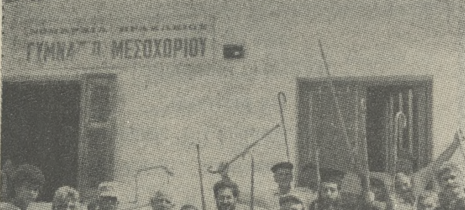
Βαία στην περίπτωση αυτή εμφανίζεται το παράδοξο να μην θέλουν ένα σχολείο...