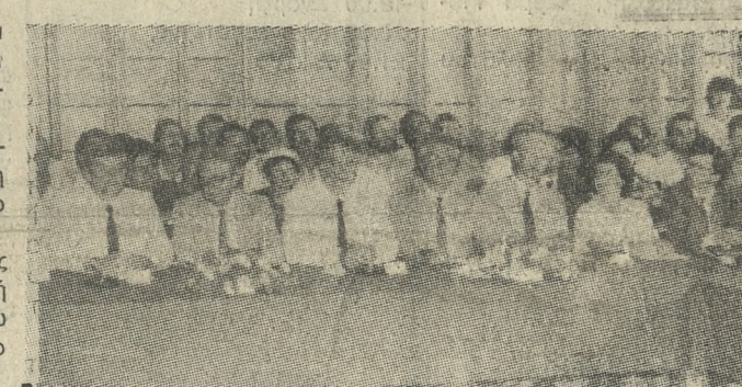
Στιμιότυπο από την τελετή υπογραφής του ΜΟΠ Κρήτης.

— Το άνοιγμα σε επενδύσεις από μέρους της ιδιωτικής πρωτοβουλίας στην Βιομηχανία κυρίως και αυτά φυσικά στα πλαίσια της