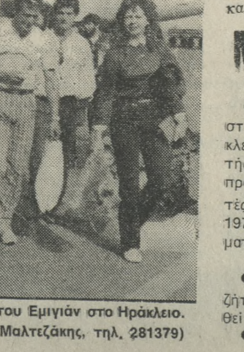
Ενα στιγμιότυπο από την άφιξη του Εμιγιάν στο Ηράκλειο.

Εκπλήξη προκάλεσε στον φιλάθλο κόσμο του Εργοτέλη η συμμετοχή του Χατζηπαναγιώτου στο παιχνίδι κυπέλλου με τον Αρη αφού ήταν τιμωρημένος για 1 μήνα από τον κ. Τζιμπού. Όπως μας είπε χθες ο κ. Σκουτέλης αλλά και ο κ. Τζιμπού Σκουτέλης αλλά και ο κ. Τζιμπού δήλωσε ότι η ομάδα θα αγωνιζόταν με 11 παίκτες με τον Αρη και στην περίπτωση αυτή έγινε κάποια εξαιρετική. Πάντως από εδώ και πέρα των παραπάνω οι τιμωρίες θα