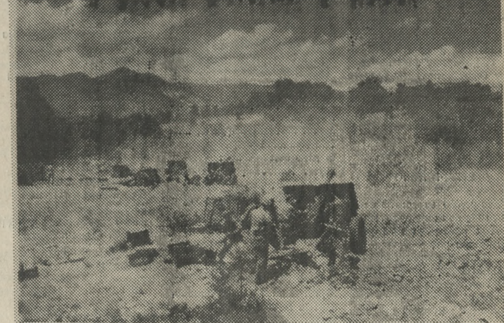
Φωτογραφία ντοκουμέντο, από τον ηρωικό αγώνα του Ελληνικού Λαού κατά του Κιτλεροφασισμού. Η φωτογραφία έχει ληφθεί στα Αλβανικά σύνορα από τον ηρωικό Αντισυνταγματάρχη του Πυροβολικού Ραδάμανθυ Σπανογιαννίδη, υπό τις διαταγές του οποίου οι Έλληνες στρατιώτες κατάφεραν σοβαρό πλήγμα στα εχθρικά στρατεύματα. Διασώθηκε δε μέχρι σήμερα με την αφιέρωση: «Στους ήρωες νεκρούς του αγώνα, αλλά και στον Ελληνικό Λαό, για την Ελευθερία του οποίου ο Ελληνικός Στρατός μας έκανε το χρέος του».