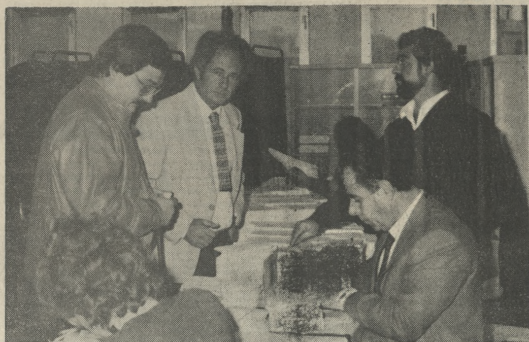
Μέσα σε κλίμα ηρεμίας έγιναν οι εκλογές στο ΤΕΕΤΑΚ.