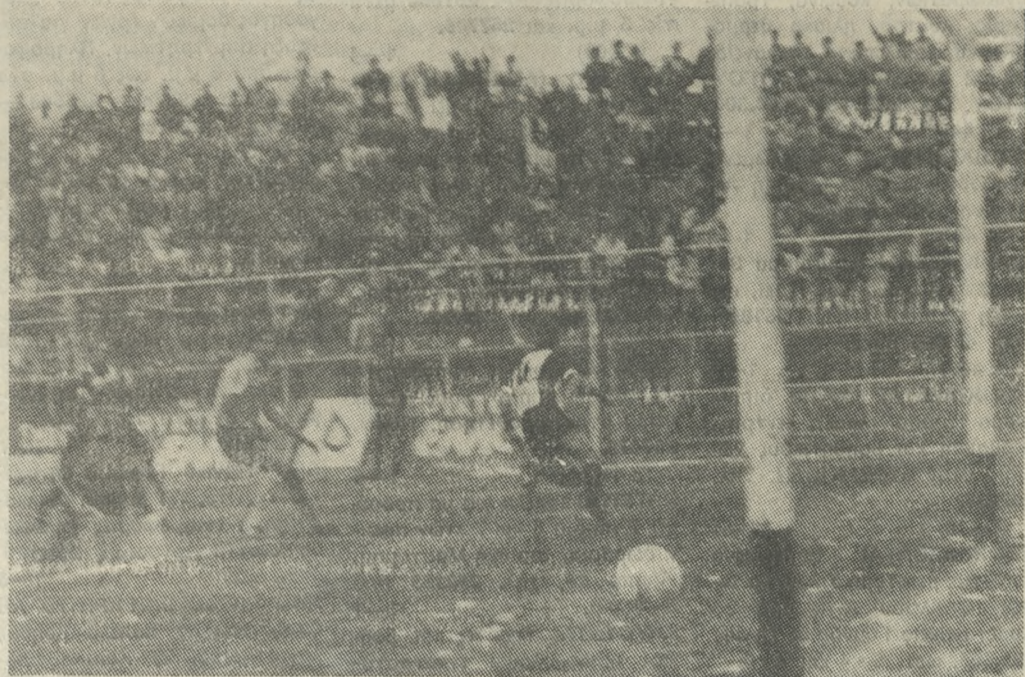
Ο Σαμαράς σημειώνει το 3ο γκολ του ΟΦΗ.

Τα γκολ: Παπαβασιλείου - Χαραλαμπίδης - Σαμαράς