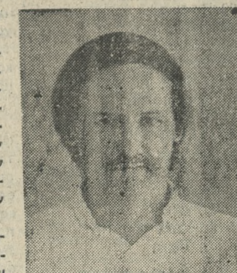
Σοφή δήλωση έκανε χθες στην Βουλή ο βουλευτής Ηρακλείου του ΠΑΣΟΚ ότι οι Κρητικοί είναι ονομαστικοί για το πείσμα τους.

Σε ολομέτρη επίθεση κατά της αρχικής απόφασης του υπουργού Δικαιοσύνης κ. Κουτσογιώργα να απορριφεί το αίτημα της ίδρυσης έδρας Μεταδοτικής Εφετείου στο Ηράκλειο, πέρασαν από χθες σύλλογοι και μαζικοί φορείς των Νομών Ηρακλείου και Λασιθίου αλλά και μαζί μ' αυτούς το σύνολο της Κοινής Γνώμης των δύο Νομών.