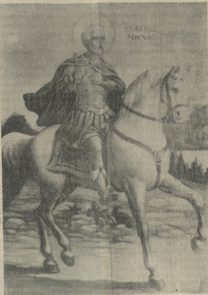
Η πόλις Ηρακλείου αγάλλεται και χαιρεί, Σε Πολιούχον σχοούσα Μηνά Θαυματουργά.