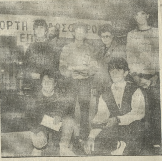
Οι αριστέουσες μαθήτριες που τιμήθηκαν από την ΕΠΣΗ με αναμνηστική πλακέτα και με το συμβολικό χρηματικό ποσό των 10.000 δρχ. καθένας.

— ΣΤΟΝ ΟΦΑ Αρκαλοχωρίου για την κατάρτιση του τίτλου του Παιδικού πρωταθλήματος. — ΣΤΙΣ Παιδικές ομάδες Ερασιτέχνη ΟΦΗ, Εργοτέλη, Ηρόδοτου, ΠΟΑ Εθνικού, ΕΡΟΝ, ΠΟΑΑ, ΑΕΚ, ΑΟΚΑ, Θερπίου.