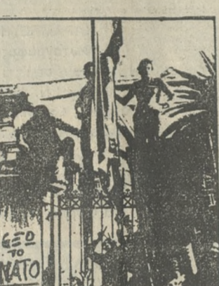
Πορεία των φοιτητών και σπουδαστών στην πόλη του Ηρακλείου.

Νωρίτερα, στις 6 μ.μ., στην αίθουσα της Βασιλικής του Αγ. Μάρκου θα γίνουν ομιλίες από τη Σ.Ε. και άλλους φορείς, ενώ θα διαβάσουν και χειροκροτηθεί η Διακήρυξη.