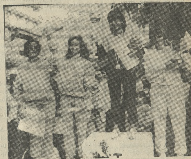
Οι αθλήτριες που πήραν τις πρώτες θέσεις στον 2ο Διεθνή Βαρδινογιάννιο Μαραθώνιο Δρόμο.

Ρομανός — Φοδύλα, γήπεδο Εργατικής, διαιτητής ο κ. Στεφανίδης.