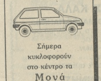
Σήμερα κυκλοφορούν στο κέντρο τα Μονά (1,3,5,7,9)

Ο κ. Ηλίας Σανιδάς περιέγραψε ως εξής το περιστατικό στην «Π»: