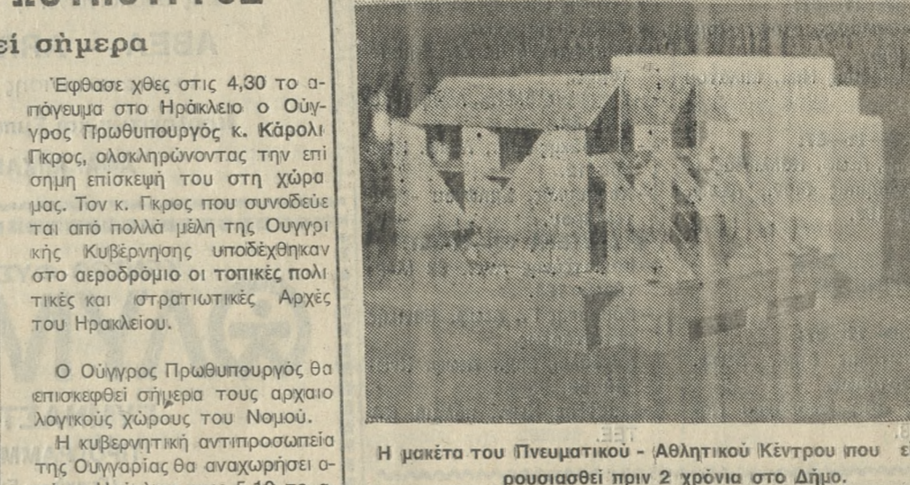
Η μακέτα του Πνευματικού - Αθλητικού Κέντρου που είχε παρουσιασθεί πριν 2 χρόνια στο Δήμο.

ΑΝΤΙΒΑΡΟ ΣΤΙΣ ΡΥΣ «Δεν ήταν τυχαία η εκλογή του συγκεκριμένου χώρου για την ανέγερση του Κέντρου» σημείωσε ο κ. Σαρρής, «Είναι σε μια περιοχή που έχει πολλές ΡΥΒ ΔΙΣΚΟ και θα μπορούσε να λειτουργήσει σαν αντίβαρο για τη νεολαία».