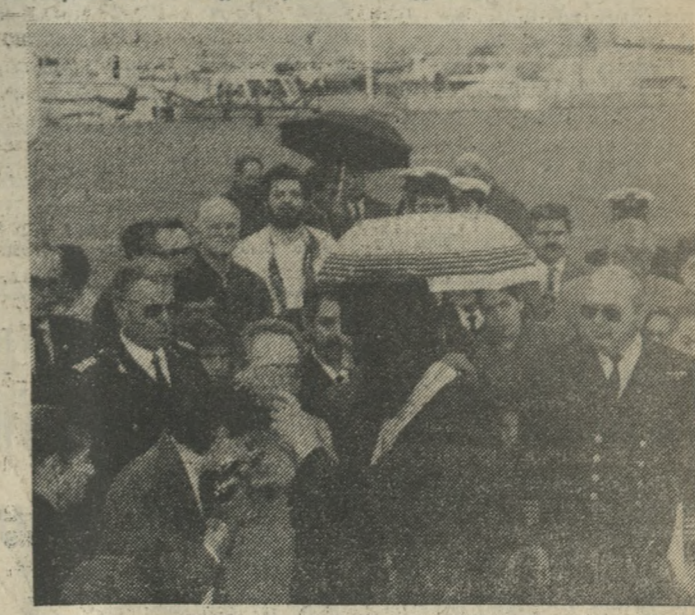
Από την τελετή που έγινε στο Λιμάνι, μπροστά στο Κεντρικό Λιμεναρχείο Ηρακλείου.