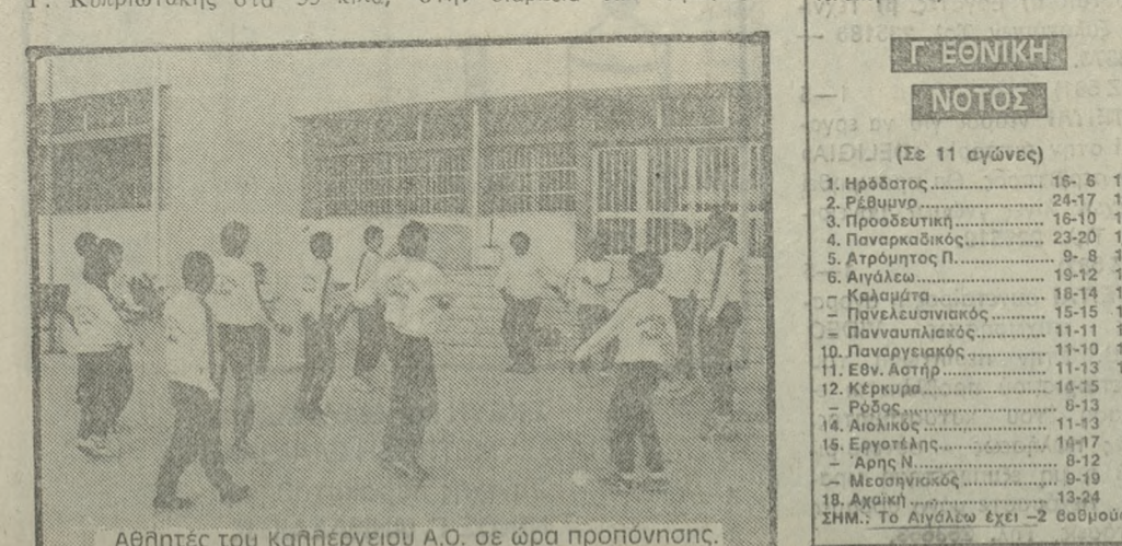
Αθλητές του Καλλεργείου Α.Ο. σε ώρα προπόνησης.