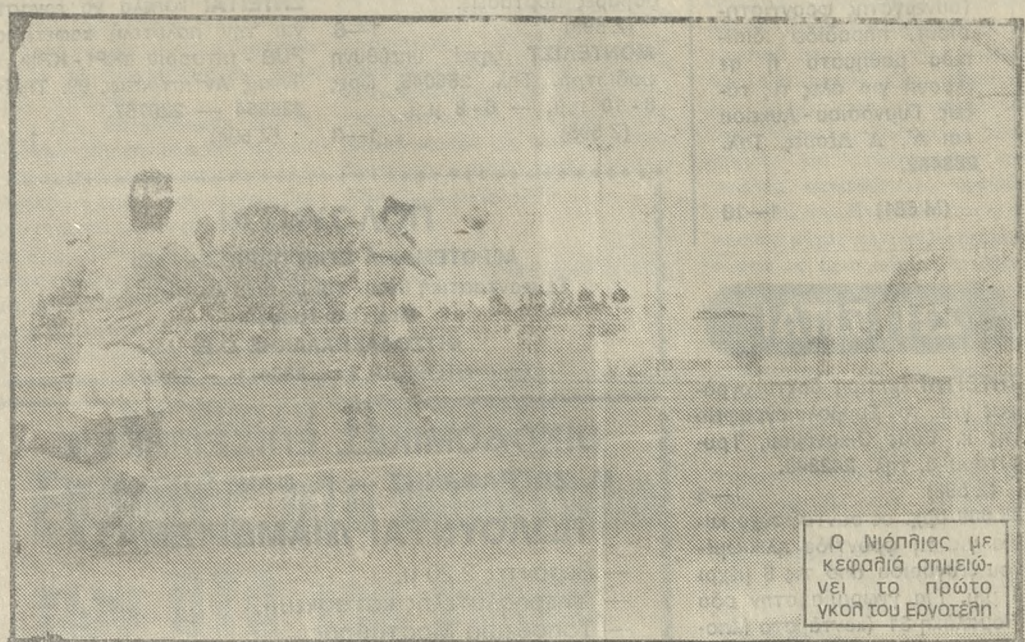
Ο Νιόπλιας με κεφαλιά σημείωσε το πρώτο γκολ του Εργοτέλη