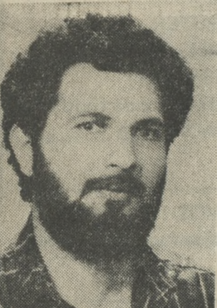
Ο Πρόεδρος του ΕΚΗ κ. Γιάννης Κουράκης

Κέντρο, θέμα συζήτησης θα είναι η διοργάνωση της πανεργατικής απεργίας που θα γίνει την ερχόμενη Τρίτη.