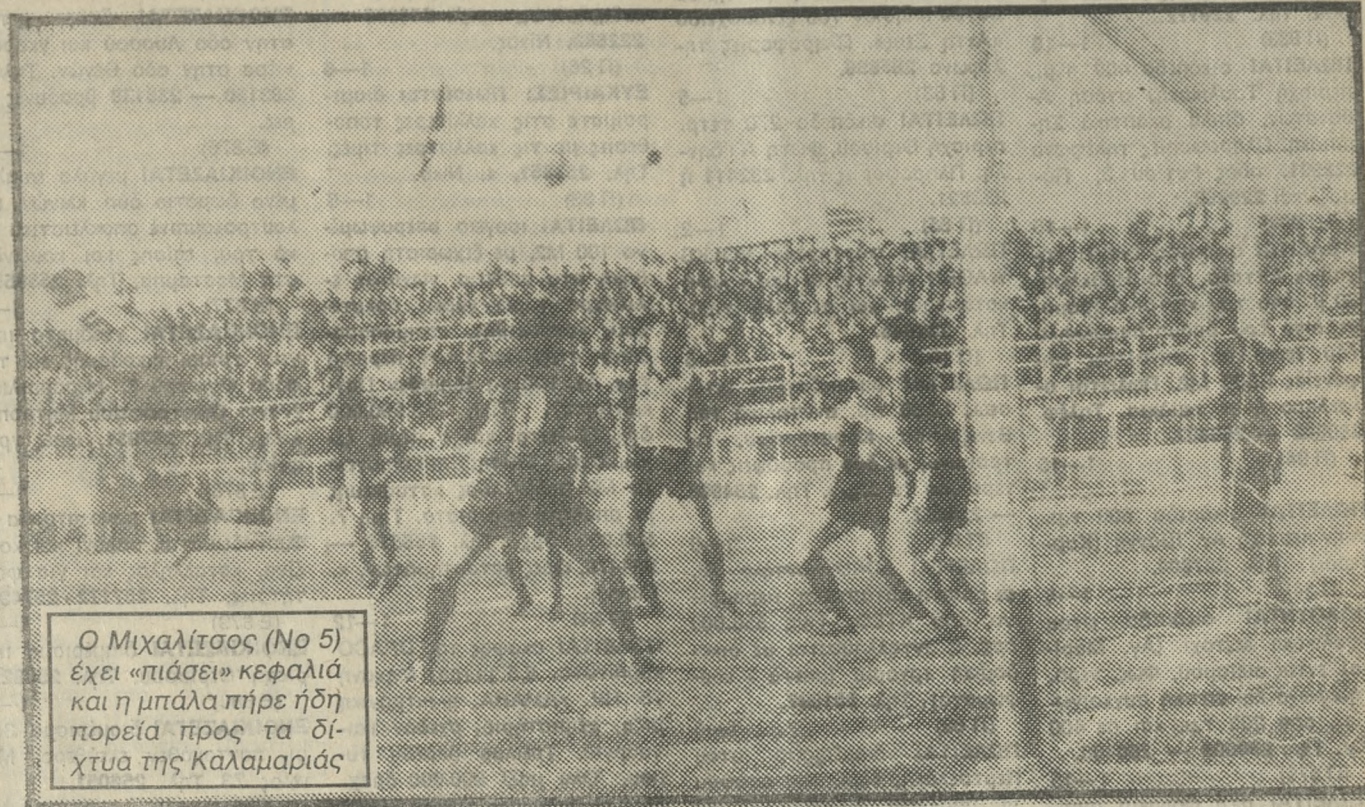
Ο Μιχαλίτσος (No 5) έχει «πίσει» κεφαλιά και η μπάλα πήρε ήδη πορεία προς τα δίχτυα της Καλαμαριάς

Η ΤΑΞΙΑΡΧΙΑ του Έινκε Γκέρραντ πρόσθεσε την Κυριακή μία ακόμη νίκη στο ενεργητικό της. Επιβλήθηκε άνετα της Καλαμαριάς με 4-0 και σε συνδυασμό με τα άλλα αποτελέσματα, πέρασε μόνη δεύτερη στον βαθμολογικό πίνακα. Για μία ακόμη φορά οι φίλαθλοι του ΟΦΗ αναγνώρισαν την προσφορά και το έργο του Ολλανδού προπονητή, γεγονός που αποδεικνύεται από το ότι τόσο στην διάρκεια όσο και μετά την λήξη του αγώνα τον χειροκρότησαν θερμά και φώναζαν ρυθμικά «Γκέρραντ - Γκέρραντ». Τώρα ο ΟΦΗ βλέπει με μεγαλύτερη σιγουριά το μέλλον, δεδομένου ότι μεσολάβησε η διακοπή του πρωταθλήματος (λόγω της συνάντησης της Εθνικής μας με την Ολλανδία) και όταν ξαναρχίσει θα έχει στην δύναμή του και τους νεοπροσκτηθέντες ποδοσφαιριστές. Βίβαια θα πρέπει να πούμε ότι οι προεργείες συναντήσεις θα είναι καθοριστικής σημασίας για τον ΟΦΗ, παρά το ότι ο παραθλάμιος του πρωταθλήματος είναι ακόμη στην αρχή. Να δούμε, όμως, πως εξελίχθηκε ο αγώνας ΟΦΗ - Καλαμαριάς, περιγράφοντας τα γκολ και τις κυριότερες φάσεις: