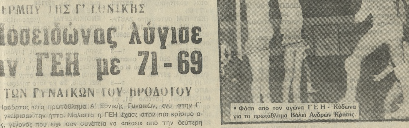
Φάση από τον αγώνα ΓΕΗ - Κιδώνας για το πρωτάθλημα Βόλεϊ Ανδρών Κρήτης.