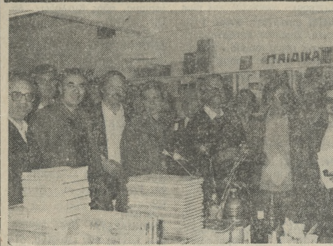
Στιγμιότυπο από την παρουσίαση της ποιητικής συλλογής του Βασίλη Ζεβελάκη.

Η επιτροπή των μπανανοκαλλιεργητών θα συνεδριάσει τις προσεχείς μέρες για την κλιμάκωση του αγώνα.