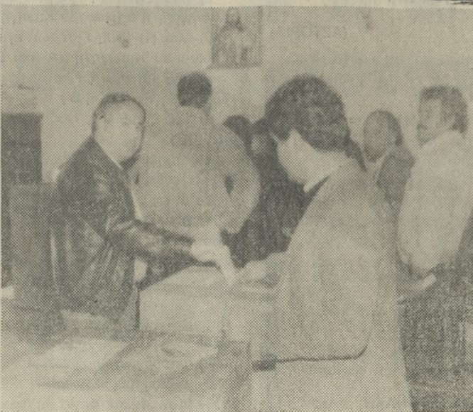
Στημιότυπο από τις προχθεσινές εκλογές στο Επαγγελμασιοβιοτεχνικό Επιμελητήριο.