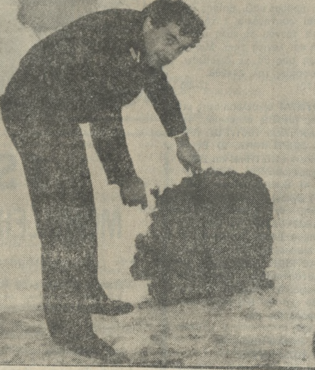
Από εδώ δραπέτευσαν οι τρεις κρατούμενοι.