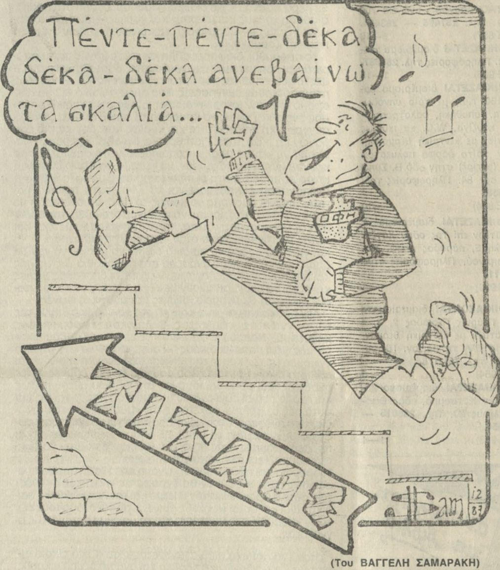
(Του ΒΑΓΓΕΛΗ ΣΑΜΑΡΑΚΗ)

Συνθηματικό φαινόμενο έχουν γίνει πια οι ήττες για την Μινωική. Έτσι δεν προξέει ιδιαίτερη αίσθηση η συντριβή της από τον ΑΟΑΝ με σκορ 3-0, την Κυριακή το απόγευμα στο γηπεδο του Εργοτέλη. Η ήττα αυτή, που είναι η ενδέκατη σε σύνολο 13 αγώνων, ήρθε σαν φυσικό επακόλουθο της επιθετικής ανυπαρξίας της ομάδας από την Φορτέτσα και όχι μόνο αυτής. «Όπου φτωχός και η μοίρα του», λέει ο Έλληνας και το ρητό αυτό ταιριάζει απόλυτα για την Μινωική. Δεν έφταναν όλα τα προβλήματα των τιμωριών, δεν έφταναν τα αγωνιστικά προβλήματα που αντιμετωπίζει κατά την διάρκεια του αγώνα, ήρθε και η απόδοσή του Ασπασιώτικου και θύελλα από και πάλι ήταν ακόμη πιο εύκολη υπόθεση για τον ΑΟΑΝ η εξασφάλιση της νίκης. Δίκαιη πέρα για πέρα χαρακτηρίζεται η εύκολη, όπως εξελίχθηκε το παιχνίδι, επικράτηση της ομάδας του Αγίου Νικολάου. Μια ομάδα που μπορεί να μην «έπιασε» εντυπωσιακή απόδοση, ήταν όμως εμφανώς καλύτερη από την Μινωική. Και αν μη τι άλλο, είχε αυτό που λέμε επιθετική «απριτίδα» με πρωταγωνιστή τον διακριθέντα