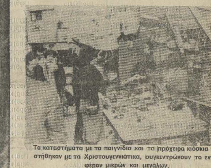
Τα καταστήματα με τα παιχνίδια και τα πρόχειρα κίσκεια που στήθηκαν με τα Χριστουγεννιάτικα, συγκεντρώνουν το ενδιαφέρον μικρών και μεγάλων.