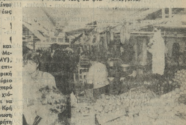
Επάρκεια ειδών στην Κεντρική Αγορά της πόλης, αλλά η κίνηση μικρή.

θα έχουμε βροχές και καταγί- δες, η θερμοκρασία θα κυμαν- θεί από 5 μέχρι 10 βαθμούς, ενώ οι άνεμοι στο Αιγαίο και στο Κρητικό Πέλαγος θα είναι ασυχνή μέχρι θυελλώδεις και τοπικά η έντασή τους θα φτά- σει τα 9 μποφόρ.