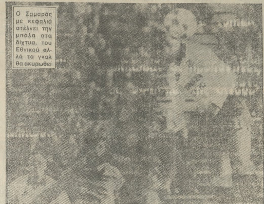
Ο Σαμαράς με κεφαλιά στέλνει την μπάλα στα δίχτυα του Εθνικού αλλά το γκολ θα ακυρωθεί