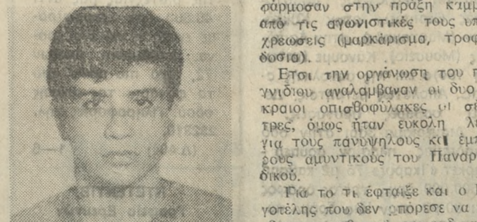
Εργ. Παχουλάκης Κατέρριψε τρία ατομικά ρεκόρ.

Στο 66' ο Μουσιώλης κερδίζει πέναλτι από τον Ορσανίδη αλλά τον αποκλείει άστοχα στέλνοντάς τη μπάλα σουτ. (683 Γ)