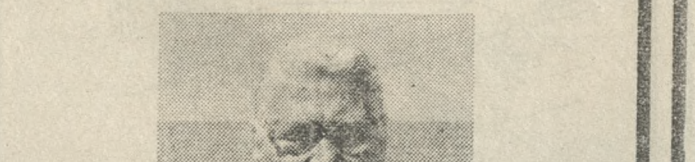
ΕΥΓΕΝΙΑΣ ΔΡ. ΚΤΙΣΤΑΚΗ

Τελούμε την Κυριακή 17 Ιανουαρίου και ώρα 9 π.μ. στον Ι.Ν. Αγ. Ιωάννου στο Σμάρι Πεδιάδος, μνημόσυνο, και καλούμε συγγενείς και φίλους να παραστούν. Ο σύζυγος: Δράκος Κτιστάκης. Τα παιδιά: Γιώργος και Ρίτσα Κτιστάκης, Αντώνης και Μίκα Κτιστάκη, Γιώργος και Μαρία Μαγαράκη. Τα εγγόνια, οι αδέρφια και οι λοιποί συγγενείς.