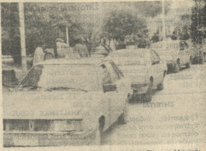
Στις πιάτσες έμειναν αραγμένα χτες τα ταξί της πόλης μας.

στους εργατοεργάτες. — Υλοποίηση προγραμμάτων Εργατικής Κατοικίας. — Δημοτικοποίηση των αστικών συγκοινωνιών. — Αντιμετώπιση ταπεινά κλιμακίων προβλημάτων που έχουν σχέση με τη στέγη, την υγεία. Ναός το απόγευμα και πριν προκληθεί η εμπλοκή στην πραγματοποίηση της απεργίας, πολλά σωματεία της δύναμης του Ε.Κ.Η. (λογιστές, τυπογράφοι, χειριστές μηχανημάτων κλπ.) είχαν εκδώσει ανακοινώσεις και καλούσαν τα μέλη τους να πάρουν μέρος στην απεργιακή κινητοποίηση.