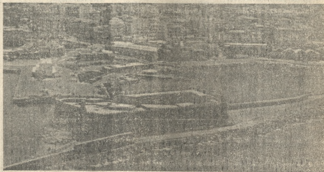
Θετική χαρακτηρίστηκε από τη Λιμενική Επιτροπή Ηρακλείου η πρόταση της ειδικής επιτροπής, να γίνει διεθνές το λιμάνι της πόλης.

στην «Π» η πρόταση της επιτροπής που αναμένεται σίγουρα να επικυρωθεί από την επιτροπή Λιμανιών οίσει μια άλλη αίγλη στο λιμάνι της πόλης αφού θα γίνει περισσότερο γνωστό σε διεθνές επίπεδο όμως τώρα μπαίνουν και υποχρεώσεις για καλύτερη δουλειά και μεγαλύτερες χρηματοδοτήσεις.