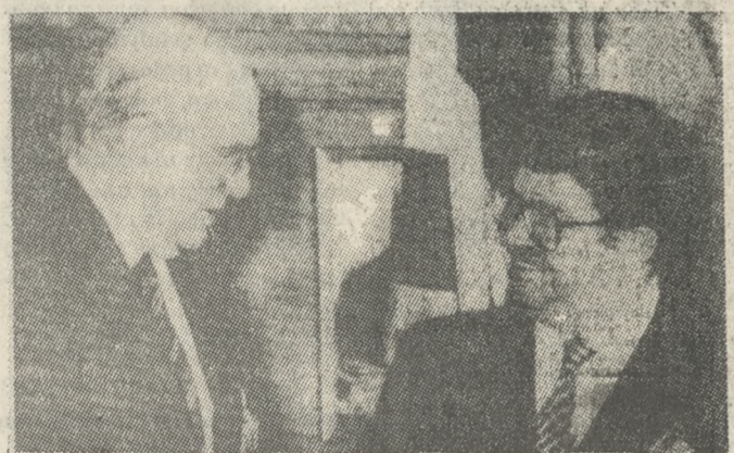
Οι κ.κ. Παπανδρέου και Οξάλ στην πρώτη τους συνάντηση στο Νταβός.

Με την επίσκεψη του Τούρκου Πρωθυπουργού Τ. Οξάλ στην Αθήνα μέσα στο 1988 αναμένεται να συνεχιστεί η νέα φάση στην οποία μπήκε η Ελληνοτουρκική σχέση, μετά τις συζητήσεις που είχε ο Πρωθυπουργός Α. Παπανδρέου με τον κ. Οξάλ, στο Νταβός της Ελβετίας το Σεπτέμβριο. Σύμφωνα με δηλώσεις του Πρωθυπουργού κ. Παπανδρέου η νέα αυτή φάση χαρακτηρίζεται από την κοινή βούληση των δύο ηγετών να μην επιδιώχθουν «λίαντα» με πολεμικά μέσα. Ο κ. Παπανδρέου εξέφρασε την ελπίδα ότι θα τηρηθούν τα όσα συμφωνήθηκαν. Και ανέφερε χαρακτηριστικά: «Η μη πόλεμος, ειρηνική πορεία είναι το μήνυμά του Νταβός».