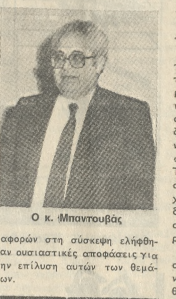
Ο κ. Μπαντουβάς

Τα προβλήματα που αντιμετωπίζει η νεοσύστατη Περιφερειακή Διεύθυνση Κρήτης, η επιτάχυνση του κατασκευαστικού προγράμματος τηλεφωνίας και η βελτίωση της ποιότητας επικοινωνίας του ηπιαού, εξετάστηκαν σε σύσκεψη που πραγματοποιήθηκε χτες στο υπουργείο Μεταφορών και Επικοινωνιών, υπό την προεδρία του υπουργού κ. Κ. Μπαντουβά.