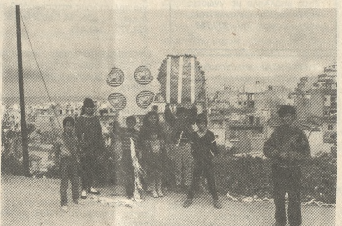
Η κακοκαιρία της Καθαρής Δευτέρας δεν επέτρεψε να δούμε ειδικές όπως αυτή.

Σε πολλά σημεία επίσης του επαρχιακού και εθνικού οδικού δικτύου σημειώθηκαν κατολισθήσεις.