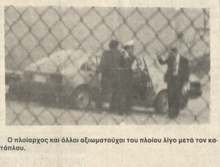
Ο πλοίαρχος και άλλοι αξιωματικοί του πλοίου λίγο μετά τον κατάπλου.

συνέχεια από σελ. 1 άρφαρτο και γι αυτούς. Οι Τούρκοι, είχαν ως τώρα, ένα πρόσθετο, πολιτικό ατού, πλεονέκτημα, πέρα από το ατού της στρατιωτικής κατοχής της μισής Κύπρου. Είχαν ένα κέντρο αποφάσεων. Την Άγκυρα. Αυτή αποφάσιζε και ο Ντενκτάς εκτελούσε με τις πράξεις πάντοτε του Τούρκου στρατηγού. Δεν ήταν το ίδιο με μας. Η Αθήνα, δίδωνε και διλώνει συμπάρα- ταξη στην Κυβέρνηση της Λευκωσίας, οι αποφάσεις όμως παίρνονταν εκεί. Η Κυβέρνηση της Κύπρου, δεν ήταν και δεν είναι, ενεργόμνημο της Αθήνας. Είναι κυρίαρχη και ανεξάρτητη ηγεσία, που αποφασίζει για τη μοίρα του νησιού, και ενημερώνει, και συνεργάζεται ισότιμα με την κυβέρνηση των Αθηνών. Αυτό όσο είναι δίκαιο και σωστό, άλλο τόσο είναι μειονέκτημα στην αντιπαράταξη μας με τους Τούρκους. Μιλάμε πάντα μόνο για το Κυπριακό, και όχι για τα άλλα ελληνοτουρκικά θέματα. Εμείς εδώ πρέπει να περιμένουμε, να αποφασίσει η Λευκω-