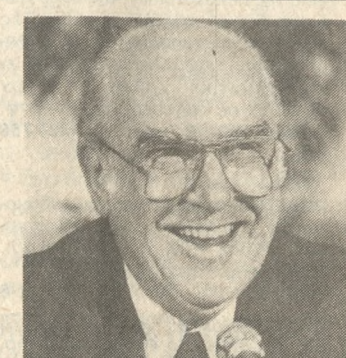
Βουλγαρίας είναι γνωστές και παραμένουν σταθερές. Η Βουλγαρία όπως και η Ελλάδα ανέφερε ο Πρωθυπουργός, δεν αλλάζουν θέσεις.

Νέα πρόταση για την απομάκρυνση των τακτικών πυρηνικών όπλων από τη Βαλκανική Χερσόνησο και ταυτόχρονα δέσμευση για μη εγκατάσταση νέων πυρηνικών όπλων στα Βαλκάνια επαναδιατύπωσε ο Πρωθυπουργός Ανδρέας Παπανδρέου και ο Βούλγαρος Πρόεδρος Τοντόρ Ζιβκόφ μετά τη λήξη των συνομιλιών που είχαν χθες και σήμερα στη Σόφια.