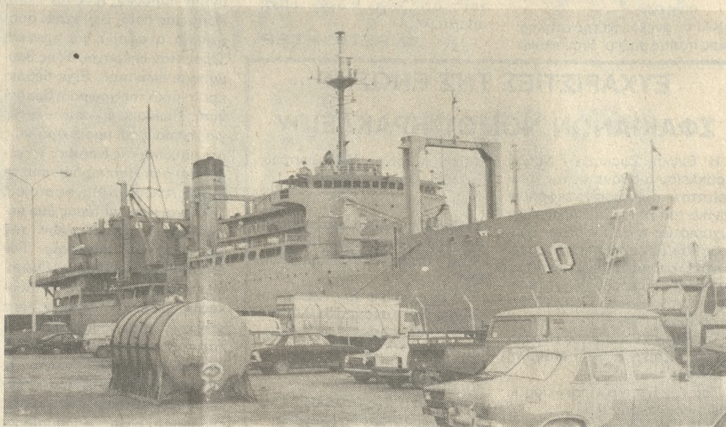
Το «SATURN» στο λιμάνι του Ηρακλείου, λίγο μετά την άφιξη του.

Το πλοίο, η άφιξη του οποίου προκάλεσε τις διαμαρτυρίες φορέων και κομμάτων που χαρακτηρίσαν την επίσκεψη «πρόκληση», έφθασε λίγο έξω από το Ηράκλειο τα μεσάνυχτα της Δευτέρας προς την Τρίτη και αγκυροβόλησε επί