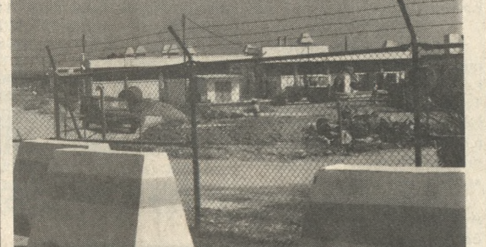
Για τις Γούρνες προορίζεται το υλικό που μεταφέρει το «SATOURN»