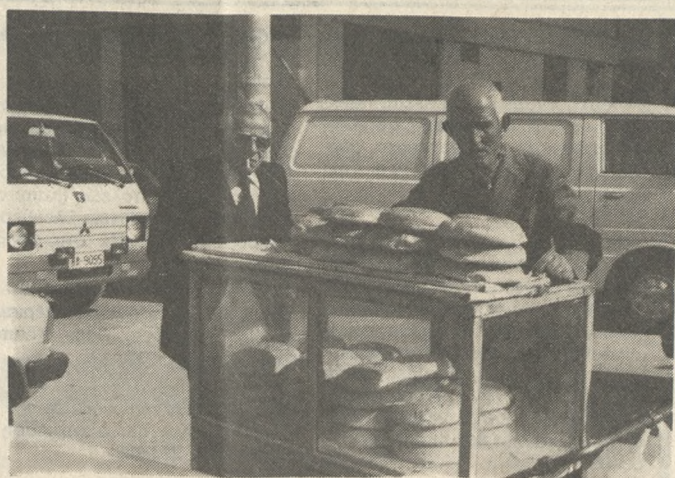
Παρά την κακοκαιρία η πατροπαράδοτη λαγάνια δεν έμεινε... «παραραιμένη».

Στα όπλα ντυμένη έκανε κούλουμα ολόκληρη η Κρήτη. Χίονια έπεσαν όχι μόνο στις ορεινές περιοχές του νησιού αλλά και στις πεδινές. Αξίζει να σημειωθεί ότι τα χιόνια έφθασαν μέχρι λίγο έξω από το Ηράκλειο. Τόσο στην Αγία Βαρβάρα όσο και στα Πεζά οι χιονοπτώσεις είχαν σαν αποτέλεσμα να κλείσουν για αρκετές ώρες οι δρόμοι.