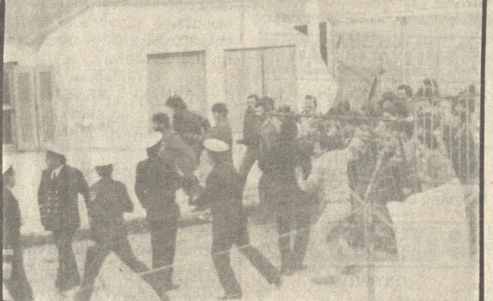
Οι διαδηλωτές πέρασαν στο χώρο της «ελεύθερης ζώνης» με απόφαση να λύσουν τους κάβους.

χθες το βράδυ. Στη συνεδρίαση παραβρέθηκε το Δ.Σ. του συνδέσμου εργοληπτών Δημοσίων Έργων, το οποίο ενημέρωσε την Διοικούσα Επιτροπή για τα προβλήματα που αντιμετωπίζουν τα μέλη του αφού έχουν να πληρωθούν, για έργα που έχουν κατασκευασεί από τον Σεπτέμβριο του 1987, με αποτέλεσμα να έχουν οικονομικά προβλήματα. Επίσης αναφέρθηκε ότι τα χρέη από το 1987 ξεπερνούν τα 450.000.000 δρχ. ενώ παρ' ότι το δημόσιο τους χρωστάει αρκετά χρήματα, εισπράττει χωρίς καθυστέρηση, διαφορετικά υπάρχουν κυρώσεις, τους φόρους και το Φ.Π.Α.