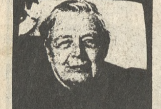
Τη Μαγκρέτ Γιουρσενάρ παρουσιάζει η αγγλική εκπομπή «Λογοτεχνικά προφίλ».

6.45 ** ΤΕΧΝΗ ΚΑΙ ΠΟΛΙΤΙΣΜΟΣ 7.30 ** ΜΙΑ ΑΠΙΘΑΝΗ ΟΙΚΟΓΕΝΕΙΑ 7.55 *** ΛΟΓΟΤΕΧΝΙΚΑ ΠΡΟΦΙΛ