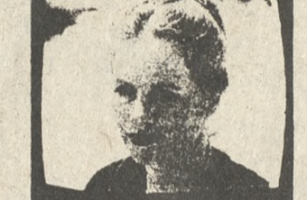
Η Λιβ Όλμαν πρωταγωνιστεί στη δραματική ταινία «Πρόσωπο με πρόσωπο».

10.05 *** ΚΙΝΗΜΑΤΟΓΡΑΦΙΚΕΣ ΕΠΙΤΥΧΙΕΣ «Πρόσωπο με πρόσωπο», Δρ. Σοφίας Παπαγιάννη 1975, οι νεότεροι Ιγκωρ Μπλεγκκιν, Γιαννατόν, Λιβ Όλμαν, Ερλιν Ζεφσον.