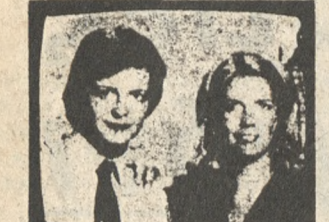
Ο Μάκιλ Φοξ και η Μέρντιν Μπίλντνερ Μπέρνι στην «Απίθανη οικογένεια».

6.45 ** ΤΕΧΝΗ ΚΑΙ ΠΟΛΙΤΙΣΜΟΣ 7.30 ** ΜΙΑ ΑΠΙΘΑΝΗ ΟΙΚΟΓΕΝΕΙΑ 7.55 *** ΛΟΓΟΤΕΧΝΙΚΑ ΠΡΟΦΙΛ