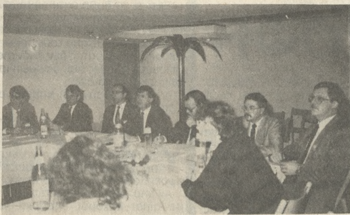
Εκπρόσωποι Ευρωπαϊκών χωρών παρακολουθούν τη σύνοδο που άρχισε χθες στο GALAXY.

Με τη συμμετοχή 24 εκπροσώπων από 12 Ευρωπαϊκές χώρες, άρχισε χθες στο ξενοδοχείο GALAXY, η τριήμερη σύνοδος για την εξέταση της μεθόδου «ONE-STOP-SHOPPING» και για την εφαρμογή της τόσο στις υφιστάμενες, όσο και στις μελλοντικές διεθνείς τηλεπικοινωνιακές υπηρεσίες, και κυρίως της υπηρεσίας των δικτύων DATA. Με τη μέθοδο αυτή επιδιώκεται, να βρεθεί