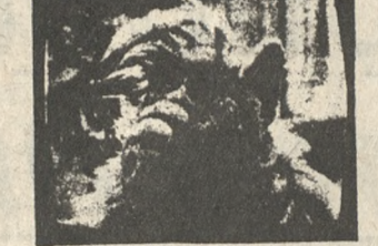
Ο χαριτωμένος «Αλφ, ο εξωγήινος».

9.00 ΕΙΔΗΣΕΙΣ 9.45 *** ΜΠΑΣΚΕΤ: ΑΡΗΣ - ΜΑΚΑΜΠΙ 11.30 ** Ο ΕΛΛΗΝΙΚΟΣ ΚΙΝΗΜΑΤΟΓΡΑΦΟΣ 12.00 ΕΙΔΗΣΕΙΣ 00.10 Ο ΕΛΛΗΝΙΚΟΣ ΚΙΝΗΜΑΤΟΓΡΑΦΟΣ (Συνέχεια)