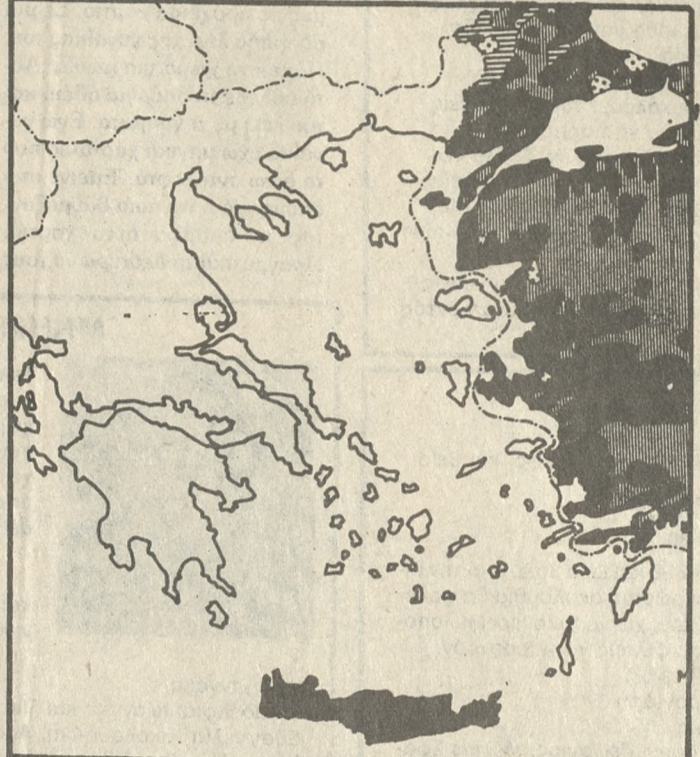
Χωρισμένοι από τον Εθνικό κορμό και σε όμοιο χρώμα με την Τουρκία εμφανίζεται ο χάρτης της Κρήτης.

που δημιουργήθηκε επειδή μιλάνε ότι η ενέργεια αυτή εκδηλώνεται σε μια κρίσιμη περίοδο με δυο ταυτόχρονα στόχους: