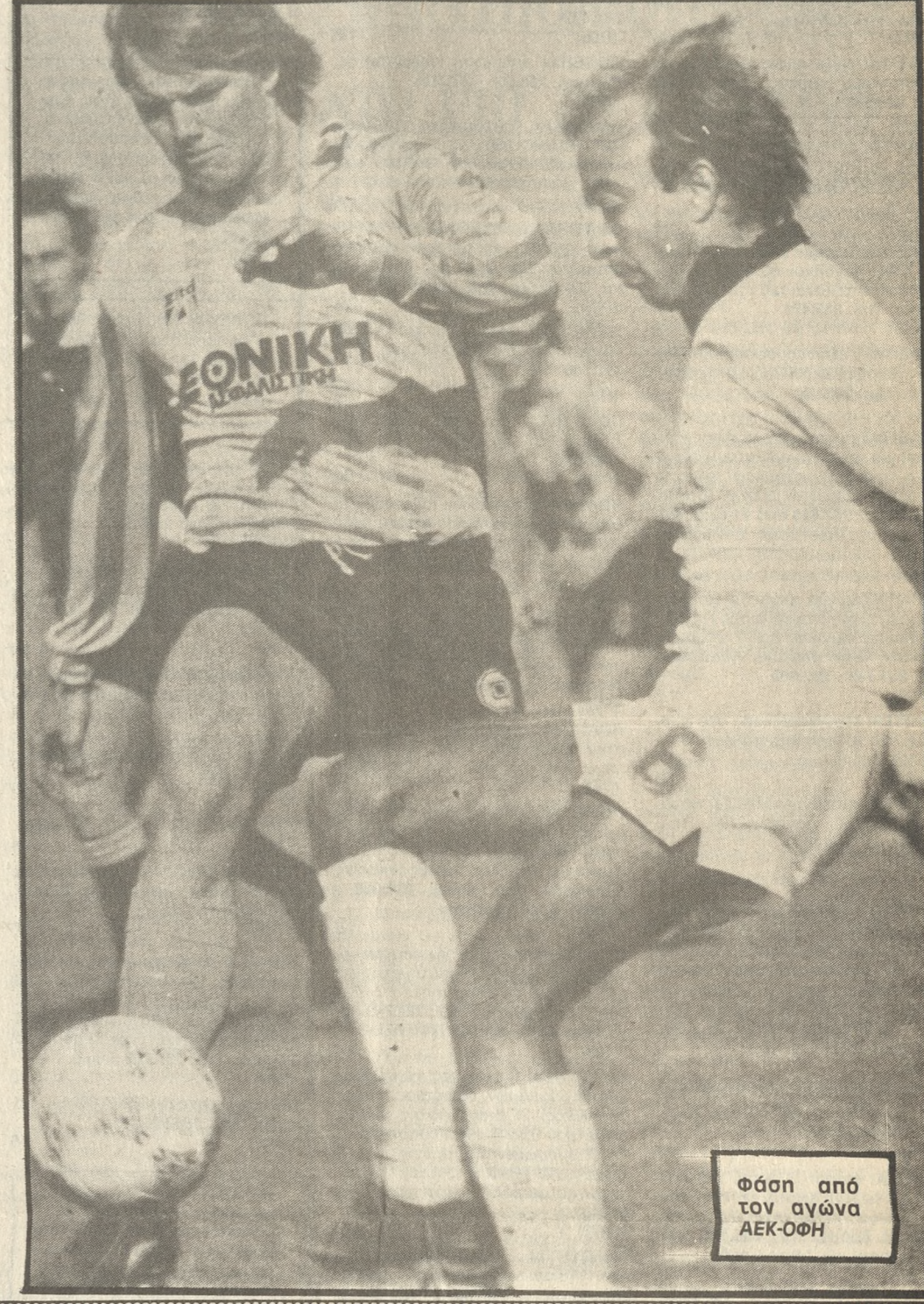
Φάση από τον αγώνα ΑΕΚ-ΟΦΗ