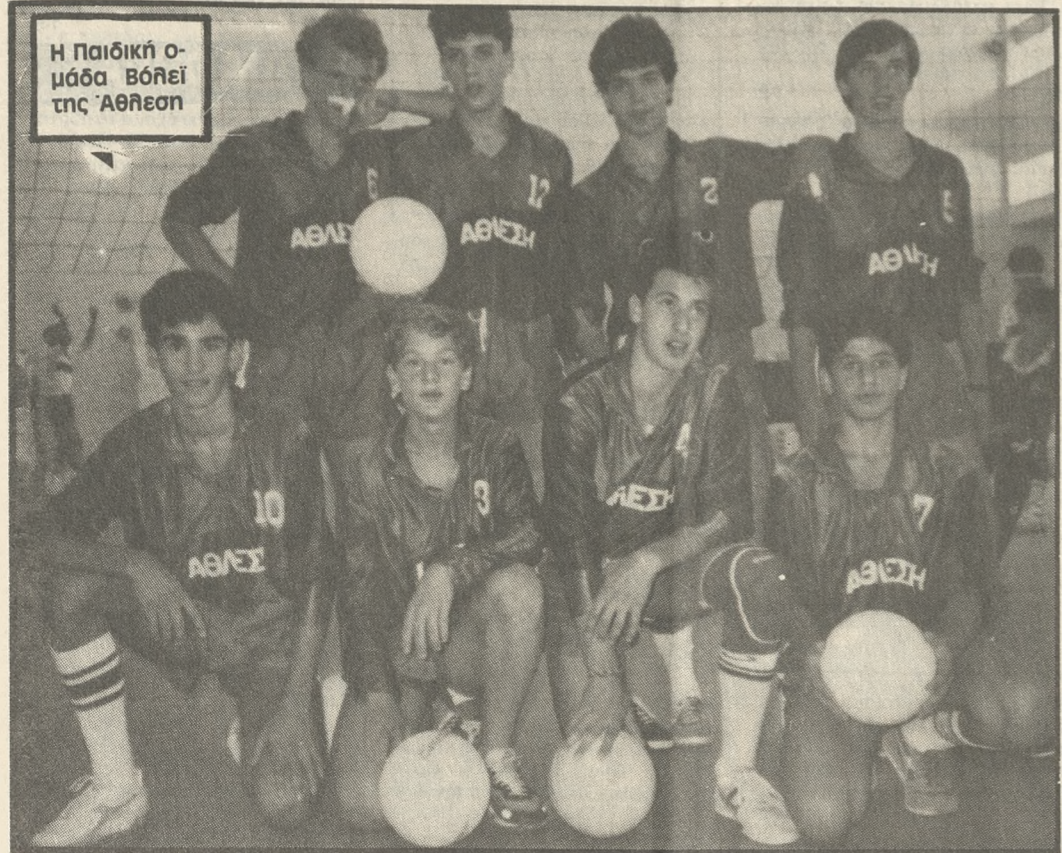
Η παιδική ομάδα βόλεϊ της Αθήσης

ΤΟ ΕΝΑ ΑΠΟ ΘΕΣΗ ΟΦΣΑΙΤ ΚΑΙ ΤΟ ΑΛΛΟ ΜΕ ΑΝΥΠΑΡΚΤΟ ΠΕΝΑΛΤΥ