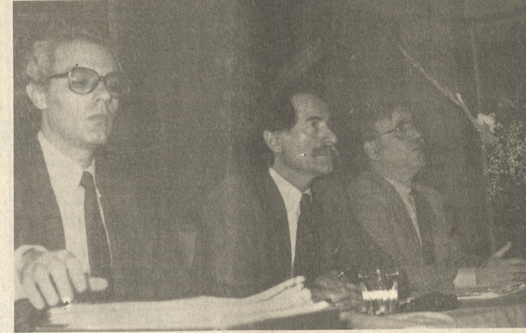
Ο υπουργός Παιδείας κ. Αντ. Τρίτσης, με τον Γ.Γ. του Υπουργείου κ. Κλάδη και τον Πρύτανη του Πανεπιστημίου Κρήτης κ. Μαρκή, στη χθεσινή σύσκεψη, στο Πανεπιστήμιο.

Στόχος η ποιοτική αναβάθμιση των σπουδών στα ΑΕΙ