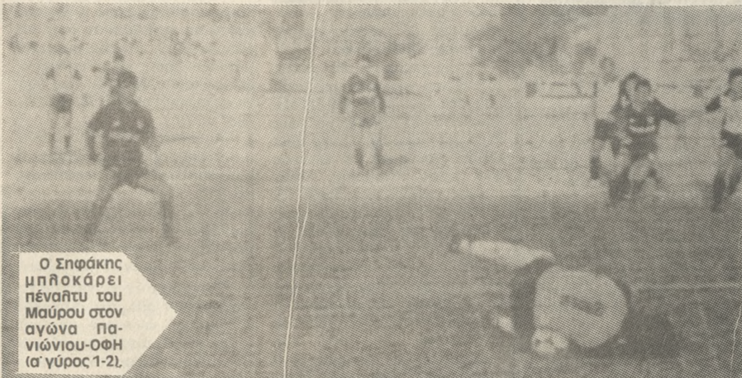
Ο Σφάκκας μπλόκάρει πέναλτυ του Μαύρου στον αγώνα ΟΦΗ-Πανιωνίου (α' γύρος 1-2).