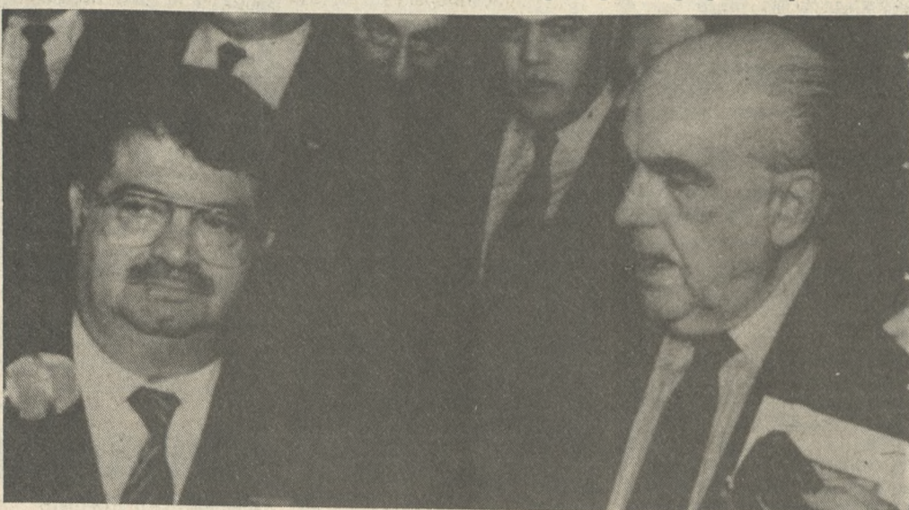
Παπανδρέου-Οζάλ. Από την κοινή εμφάνιση χθες στους Δημοσιογράφους.

Ολοκληρώθηκαν χθες στις Βρυξέλλες οι Ελληνοτουρκικές συνομιλίες κορυφής. Μετά τη δεύτερη συνάντηση που είχαν χθες το πρωί οι κ.κ. Παπανδρέου και Οζάλ εκδόθηκε η ακόλουθη κοινή ανακοίνωση τύπου: